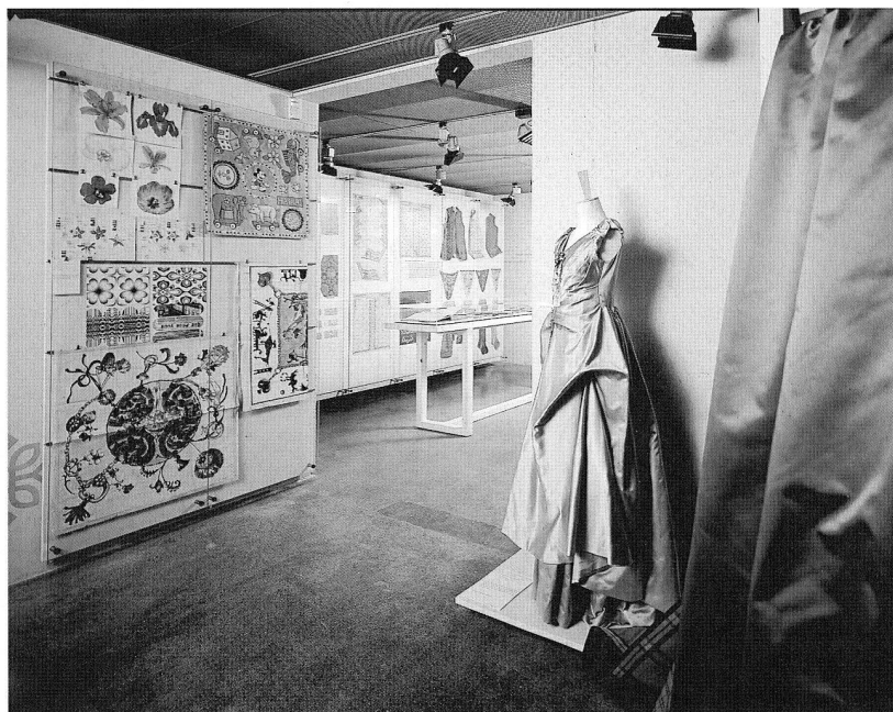
Abb. 7 Ausstellung «mustergültig. Zürcher Seidengeschichte».

Gründen im Erdgeschoss platziert. Der andere Charakter dieser mit Stuckdecken versehenen Räumlichkeiten hatte Einfluss auf die Art der Ausstellung. Die vier zur Verfügung stehenden Räume wurden thematisch gegliedert: Sasha Morgenthaler (1893–1975) – eine Künstlerin fertigt Puppen; Vergangenheit und Gegenwart begegnen sich; Puppenkinder aus aller Welt; handgefertigte Originale und serienmässig hergestellte Puppen. Die Schwiegertochter von Sasha Morgenthaler, Ruth Morgenthaler, die langjährige Mitarbeiterin der Künstlerin, Trudy Löffler, sowie die ehemalige Textilrestauratorin des Landesmuseums, Ursula Schuppli, haben sich der Konservierung der Puppen angenommen. Für die liebevolle Positionierung derselben – durch minime Veränderungen kann der Ausdruck einer Puppe komplett verändert werden – zeichneten die ersten zwei verantwortlich. Zu den weltberühmten Puppen gesellen sich die nicht minder ansprechenden Tiere. Für die Gestaltung zeichnete der Architekt Theo Senn verantwortlich.