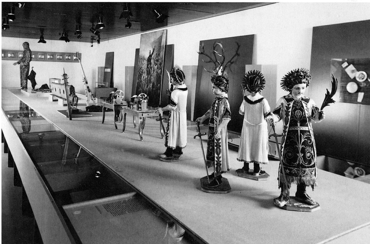
Abb. 4 Ausstellung «Schwyz: Aufstand der Dinge».

te Sonderausstellung zum Thema «150 Jahre Schweizer Zoll» hat ebenso wie die unverändert gelassene Dauerausstellung auch im Berichtsjahr wieder ein zahlreiches und interessiertes Publikum gefunden. Vor dem Hintergrund der von Historikern und einer breiten Öffentlichkeit geführten Diskussion über die Rolle der Schweiz während den Jahren des Zweiten Weltkriegs haben die für das Zollmuseum Verantwortlichen der Oberzolldirektion und des Landesmuseums beschlossen, diese Epoche im Blick auf die für die Zoll- und Grenzorgane damals schwierige Aufgabe in der Dauerausstellung ausführlicher darzustellen. Vorarbeiten für diese Neukonzeption, die im Jahre 2000 realisiert werden soll, wurden an die Hand genommen.