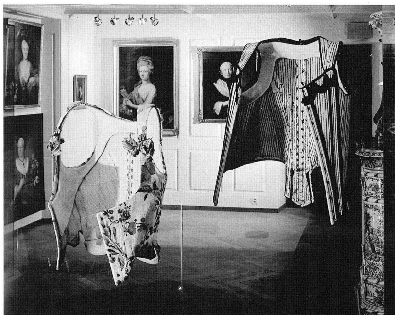
Abb. 5 Museum Bärengasse Zürich. Dauerausstellung «Vernunft und Leidenschaft»: Blick in «Private Welten/Frau sein».

Vor 28 Jahren wurden die Häuser «Weltkugel» und «Schanzenhof» auf Schienen über die Talackerstrasse verschoben. Heute sind die beiden Häuser ein Museum mit moderner Infrastruktur.