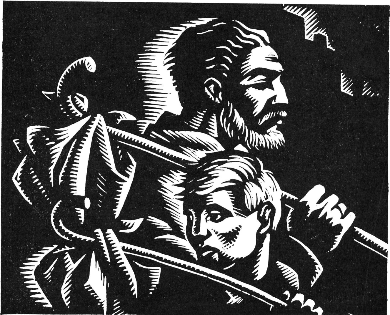
Holzschnitt von Aldo Pötocchi

ennet dem Berge im Stiche lassen; es wird der Tag kommen, an dem man unsern besondern Verhältnissen auch ein besonderes Verständnis entgegenbringen wird.