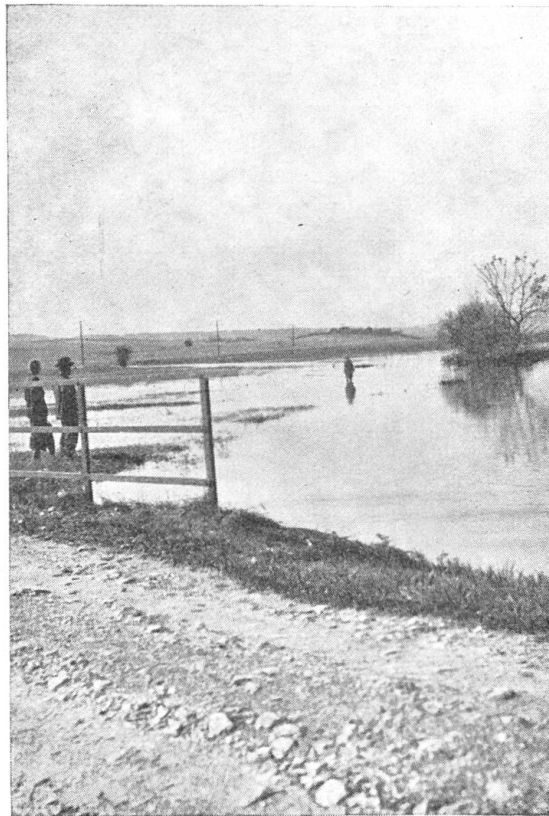
Überschwemmung des Limpach.

Von Limpach bis Wengi stehen alljährlich weite Gebiete unter Wasser.