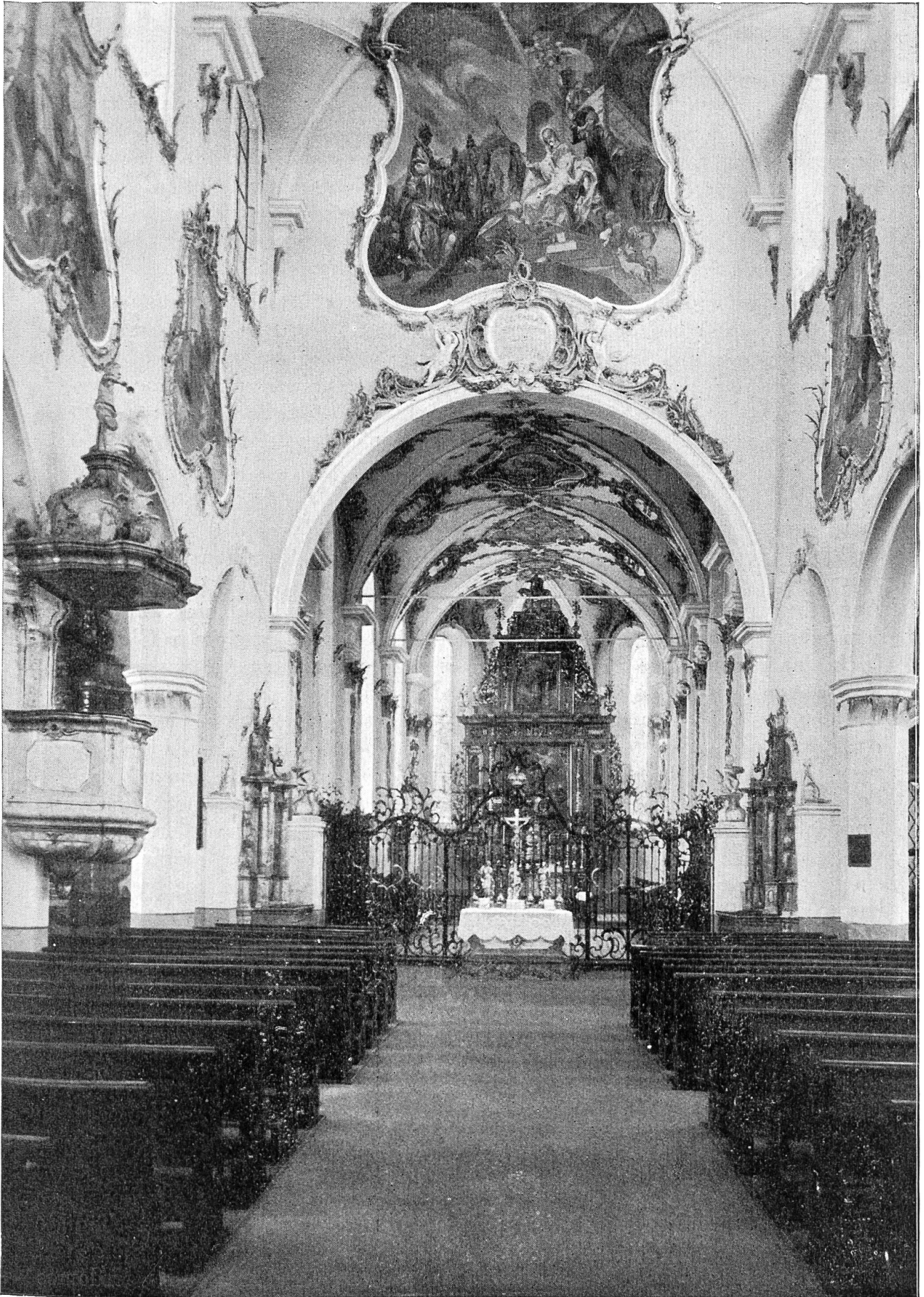
Die St. Martinskirche zu Rheinfelden