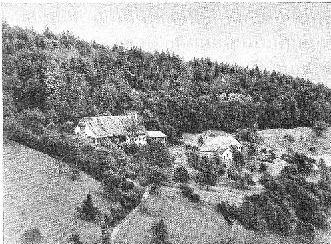
Hof Allerheiligenberg um das Jahr 1906.