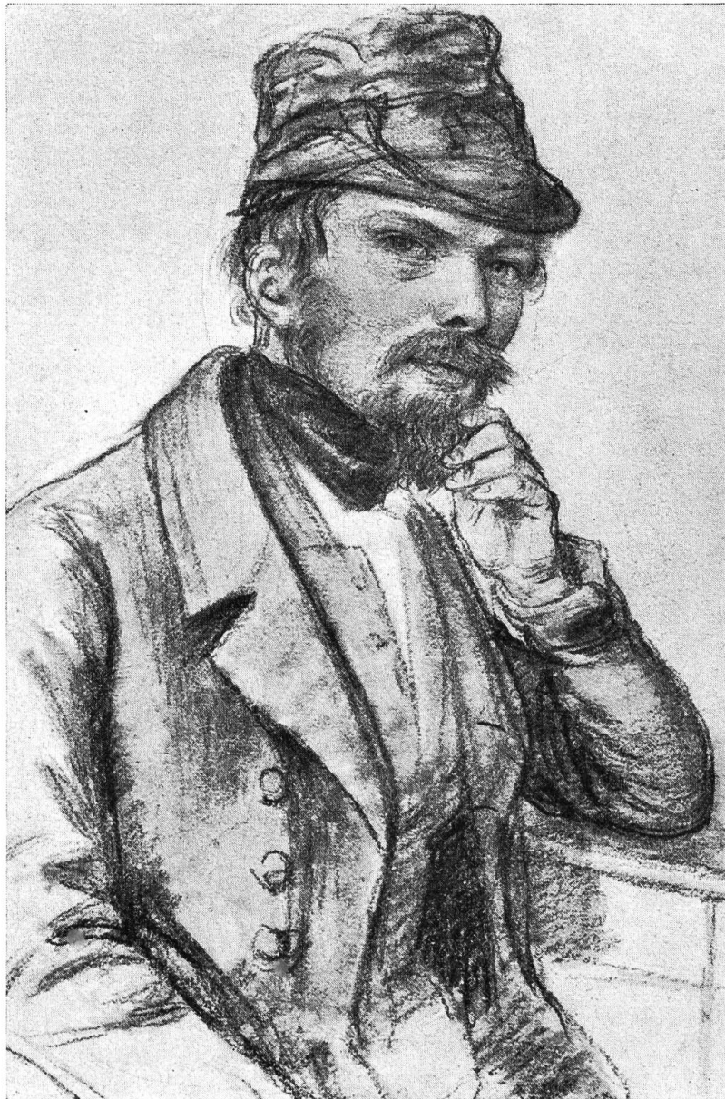
Martin Disteli. Selbstbildnis. Kunstmuseum Solothurn.