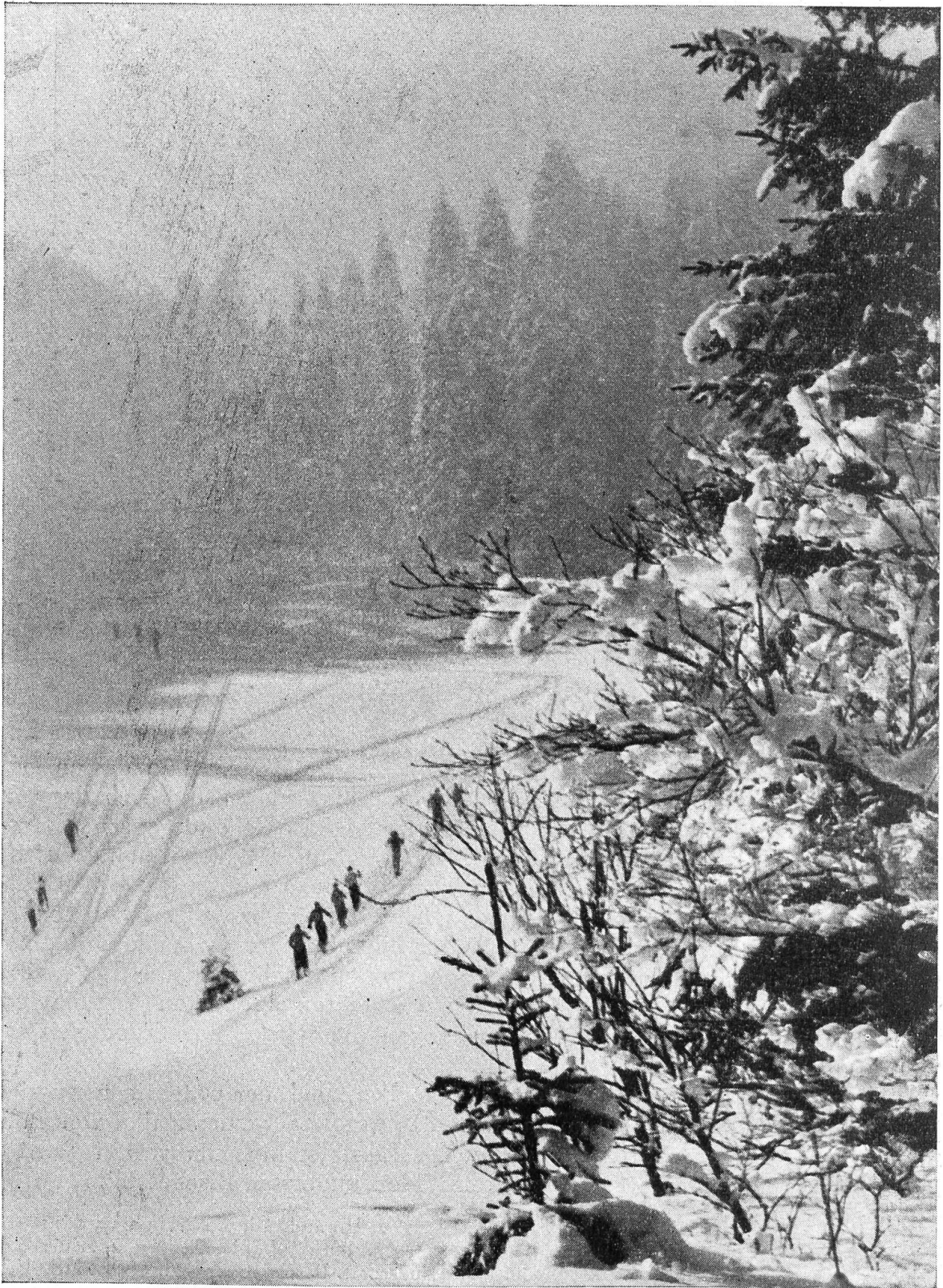
Juralandschaft im Winter.