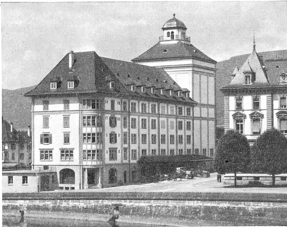
Das Lagerhaus in Solothurn.