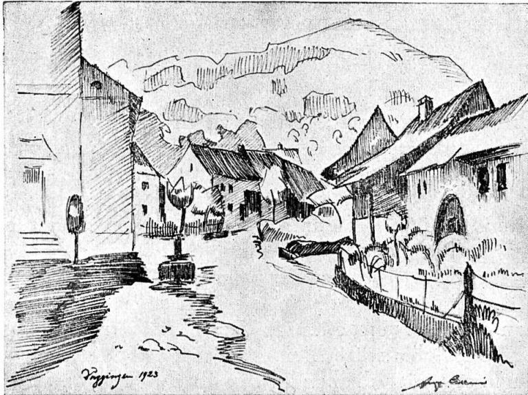
Duggingen. Zeichnung von August Cueni.

Altstätten sich ein ebenfalls abgegangener Weiler Schauwingen befunden hat. Nach diesem Schauwingen oder Schouwingen nennen sich beispielsweise die Luzerner Schobinger, denen der seinerzeitige Bundesrat Schobinger angehörte, sowie die in München und in der Pfalz lebenden Freiherren von Schowingen. (Hist. Biogr. Lexikon d. Schweiz, Artikel Schobinger).