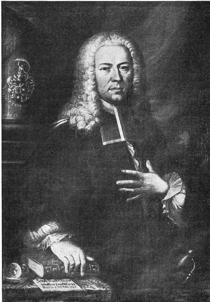
Schultheiss Joseph Benedikt Tugginer, 1681 – 1743.

Gemälde im Rathaus zu Solothurn. Maler unbekannt.