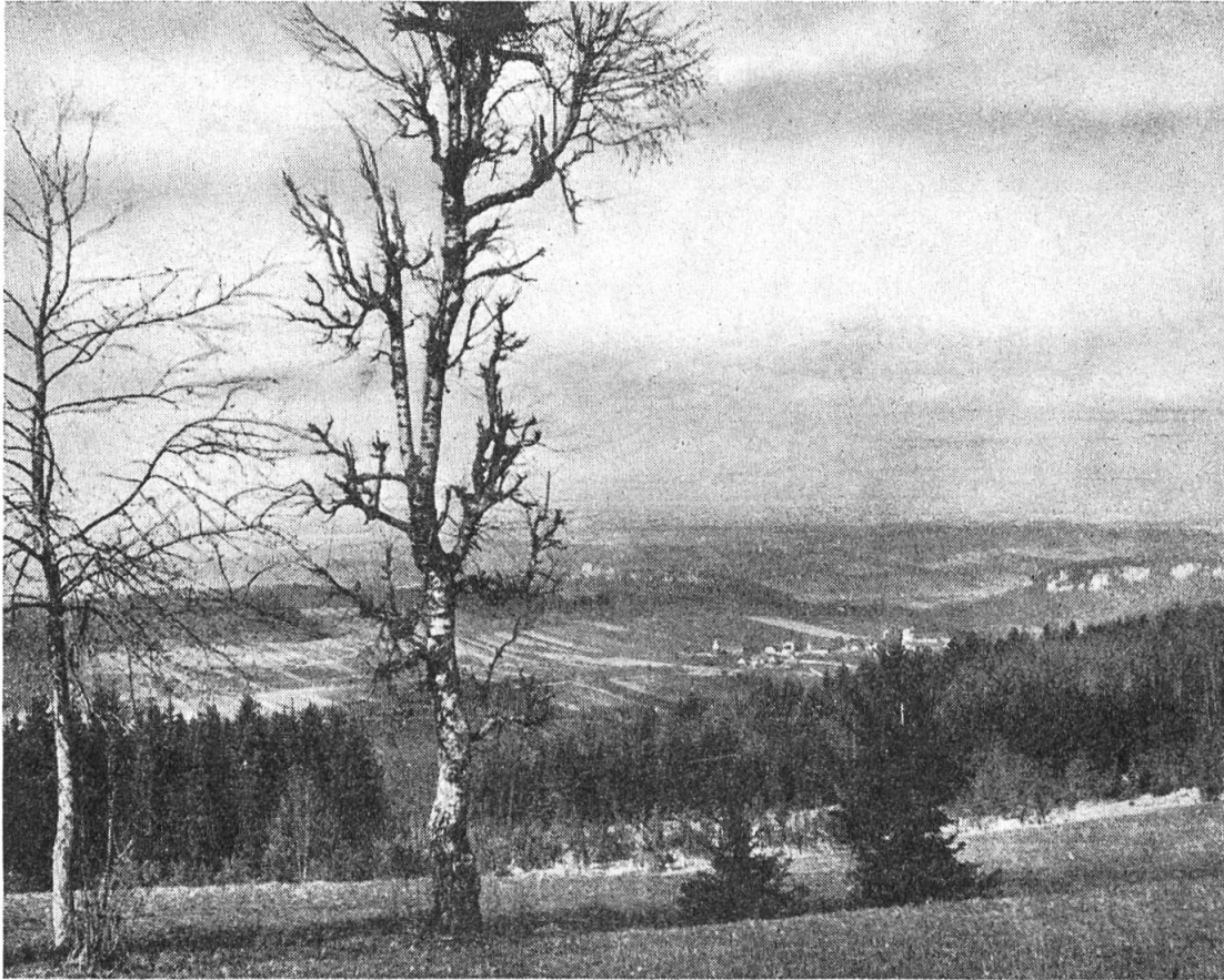
Blick vom Blauen auf das Leimental