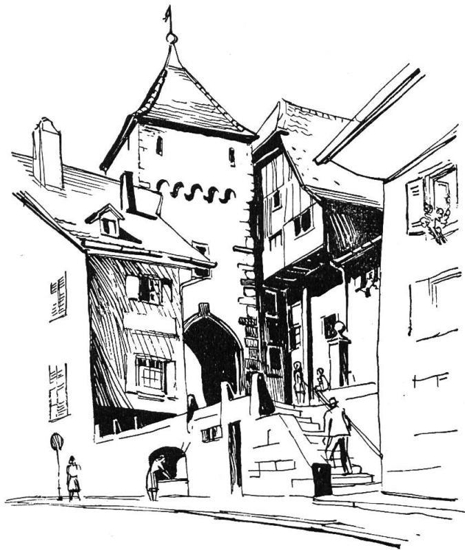
Waldenburg, das Obertor Zeichnung von Gottlieb Loertscher

Lieulich zu schauen sind auch die Miniaturgärtlein hinter den Häusern. «Das neugierige Auge sieht sie etwa durch den offenen schwarzen Hausflur hindurchschimmern, gleichsam ein goldiges Bild auf dem schwarzen Papier». In ihrem «buchsumfriedigten Bereich» hausen die Immen und gedeihen nahe beisammen sorgsam veredelte Rosen, Balsaminen, A stern, Kapuziner, Sonnenblumen und Kürbisse. In besonders freundlicher Erinnerung stehen dem Dichter die grauen, einige Quadratmeter großen, winkligen Höflein, die keinem Hause fehlen. In den frühesten Erlebnissen schildert er das Urbild aller spätern Höflein, deren er immer wieder gedenkt, «weil er hier höchstes Phantasieglück empfunden hat»: «Mitten im Hause, oder, genauer gesagt, hinten zwischen dem Wohnhause und dem Holzschopfe und den verwaisten Hühnerställen befanden sich ein weltabgeschlossenes, einsames, stilles Höflein, und innerhalb des Höfleins ein zweites, kleineres, noch einsames und stilleres. Da war nichts von der Außenwelt zu hören, auch nichts anderes zu sehen als zerfallene Bretterwände, Treppchen, Türen, Läubchen und dergleichen, und oben darüber ein Ausschnitt Himmel».