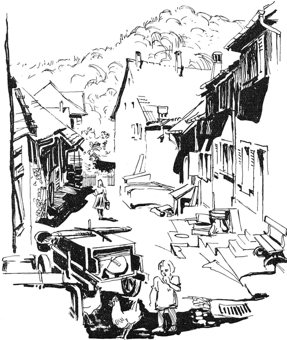
Waldenburg. Die Rindergasse Zeichnung von Gottlieb Loertscher

haucht. Der Rand der Täfelchen war erhaben, von der nämlichen Höhe wie die Figur, längs der innern Linie des Rahmens lief, kreuzweis gestrichelt, ein farbiges Kränzlein . . . . Jedes Täfelchen zeigte eine andere Figur: Vögel, Fische, Menschen, Blumensträuße . . . . Es waren Änisbrötchen.» Wonnicke Wunder bedeuteten dem Kinde auch «das Weihnachtskind, der Silvester, das Neujahrskind, Drei Könige, die Fastnacht und ganz zuletzt der Osterhas». Die schöne Jahreszeit hält der Jugend eine neue Reihe Freuden bereit vom Mai bis in den Herbst hinein. Auf die Kirschen- folgt die Birnenernte, dann der Heuet, der Emdet und