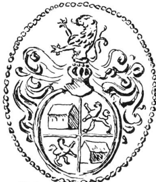
Joh. Christ. Haus 1693