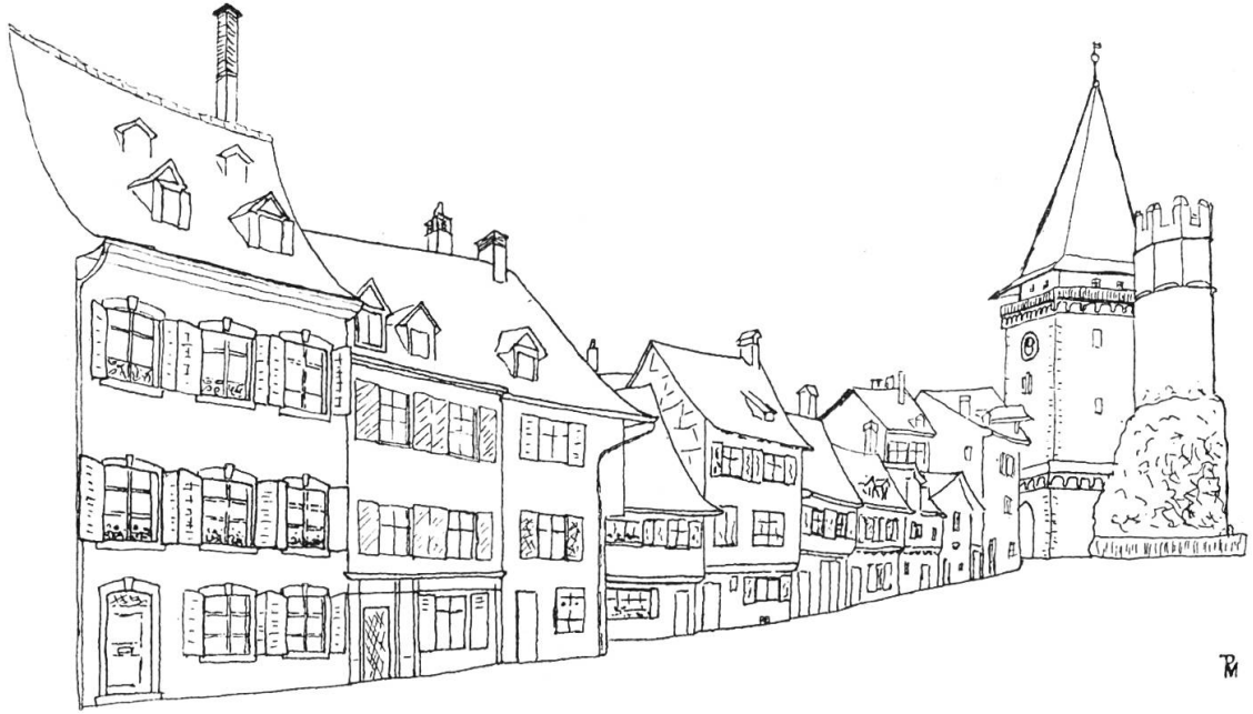
Spalengraben vor dem Umbau des «Salmen»