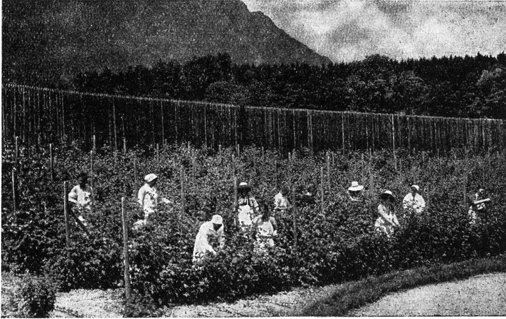
Arbeit im Beerengarten

setzen. Diese Arbeit stellt hohe Ansprüche an Bildung, pädagogisches Geschick, an die Fähigkeit der Menschenbehandlung des Personals. Durch die Ausbildungskurse und die Lehrzeit, welche der definitiven Anstellung des Pflegepersonals vorausgehen, ist ein guter Schritt vorwärts getan worden. Es ist auch besonders zu erwähnen, daß die Öffentlichkeit durch die soziale Besserstellung des Personals der Heil- und Pflegeanstalten die wichtige Aufgabe, die es in der staatlichen Gemeinschaft zu erfüllen hat, anerkennt. Wenn die unnahbaren Patienten schließlich durch kleinere Arbeiten und Handreichungen im Haushalt, Reinigung, Küchendienst, Arbeiten im Hof, Botendienste im Haus sich bereit finden, länger und intensiver zu arbeiten, so ist es Sache der Arbeitsgruppenführer und schließlich der Handwerker, in den Werkstätten das begonnene Erziehungswerk mit dem nötigen Takt, der Menschenkenntnis, Geduld und Liebe weiter zu entwickeln.