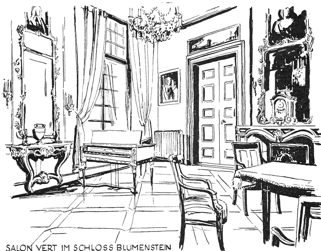
SALON VERT IM SCHLOSS BLUMENSTEIN

richtet worden ist. Dies hat nun auch die längst geplante Vereinigung unserer Steinwerke (röm. Inschriftensteine und mittelalterliche Relikte) in einem eigenen Lapidarium verzögert und bedingt neue Studien und Planungen.