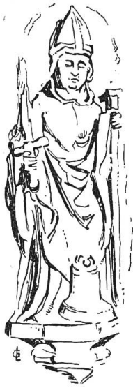
Abb. 5. Relief des Hl. Theodul auf der Glocke von 1520.

5. November in den Taufrodell: «Dieses ist das erste kind, dz in der neüw kirch getaufft, als auf disen tag dz erst mal darin wider gepredigt worden».