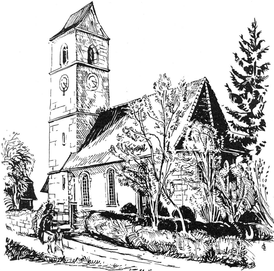
Abb. 1. Ansicht der Lüßlinger Kirche von Südosten nach der Restaurierung.

Es handelte sich, wie zu erwarten war, um Malereien, Fresken aus vor-reformatorischer Zeit, die sich bis zu diesem Zeitpunkte erhalten hatten, dann aber doch endlich übertüncht wurden, nachdem man sie vorher durch Hammerschläge beinahe gänzlich zerstört hatte. Als man diese Tünche vor fünfzig Jahren erneuerte, kamen wieder Spuren zum Vorschein, doch hielt man sie nicht der Erhaltung wert. Umsonst hoffte man nun bei der gründlichen Erneuerung des Verputzes wenigstens einzelne Teile festzustellen, um Anhaltspunkte über die Darstellung und ihre zeitliche Zuweisung zu erhalten. Doch war nur eine obere helle Schicht zu erkennen und darunter eine zweite, mit schwarzen und roten Randlinien, die eine ältere Darstellung eingerahmt hatten. Wer die bei einer Renovation in der Kirche zu Rüti b. Büren zutage getretenen Fresken kennt, kann nur bedauern, daß hier mit rauher Hand ein altes Kunstwerk zerstört worden ist. Diese Malereien haben sich nur an der südlichen Kirchenwand vorgefunden, weil die nördliche Längswand beim Umbau 1724 weiter hinausgesetzt worden ist. Doch war diese vermutlich auch bemalt gewesen.