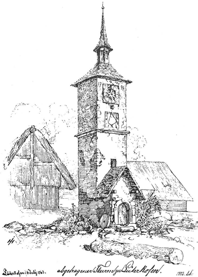
Abb. 3. Turm der ehemaligen Kapelle von Lüterkofen, abgebrochen 1863. Zeichnung von H. Jenny.

haft, daß man nur unter großer Gefahr zu den Glocken hinauf steigen kann. Von den drei Glocken könne zur Zeit nur eine geläutet werden; die eine hätte keinen Klöppel und bei der andern sei die Aufhängevorrichtung schadhaf. Der Glockenstuhl von 1669 sei noch gut erhalten (er mußte erst 1823 ersetzt werden). Das Vordächlein am Turm und diejenigen bei den zwei Eingängen müssen neu gemacht werden. Wenn das Schiff um 4 Schuh erhöht wird, müssen auch die Mauern erhöht werden, dann sind auch die Fenster zu erhöhen und in bessere Form zu bringen. Diese Aussetzungen erlauben ungefähr ein Bild vom damaligen Aussehen der Kirche zu machen. Auffallend ist geradezu der niedrige Bau des Schiffes im Vergleiche mit dem hohen Turm. Dünz berechnet die Kosten mit 400 Kronen ohne die Fuhungen. Darüber erhob sich nun ein langwieriges Markten. Die Gemeinde verweigerte die Bezahlung der hohen Kosten, da sie dazu nicht verpflichtet werden könne. Mehrmals wurden ihre Vertreter zu Audienzen nach Landshut eingeladen und nur der unermüdlichen Geduld des Pfarrers gelang es endlich, eine Einigung herbeizuführen. Eine Deputation, bestehend aus dem