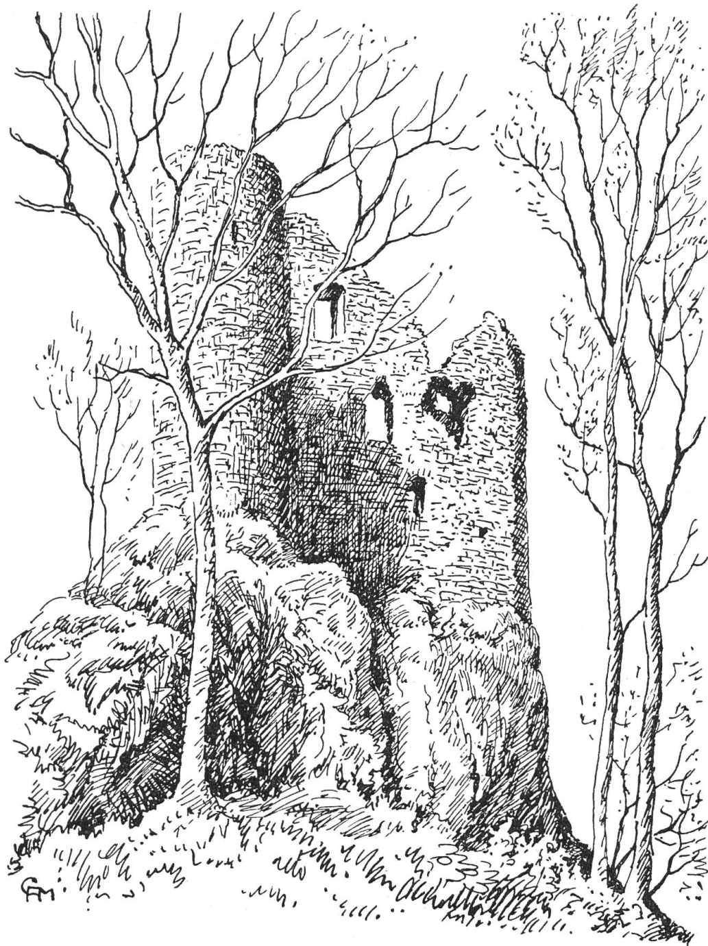
Burg Reichenstein vor dem Wiederaufbau Zeichnung von C. A. Müller