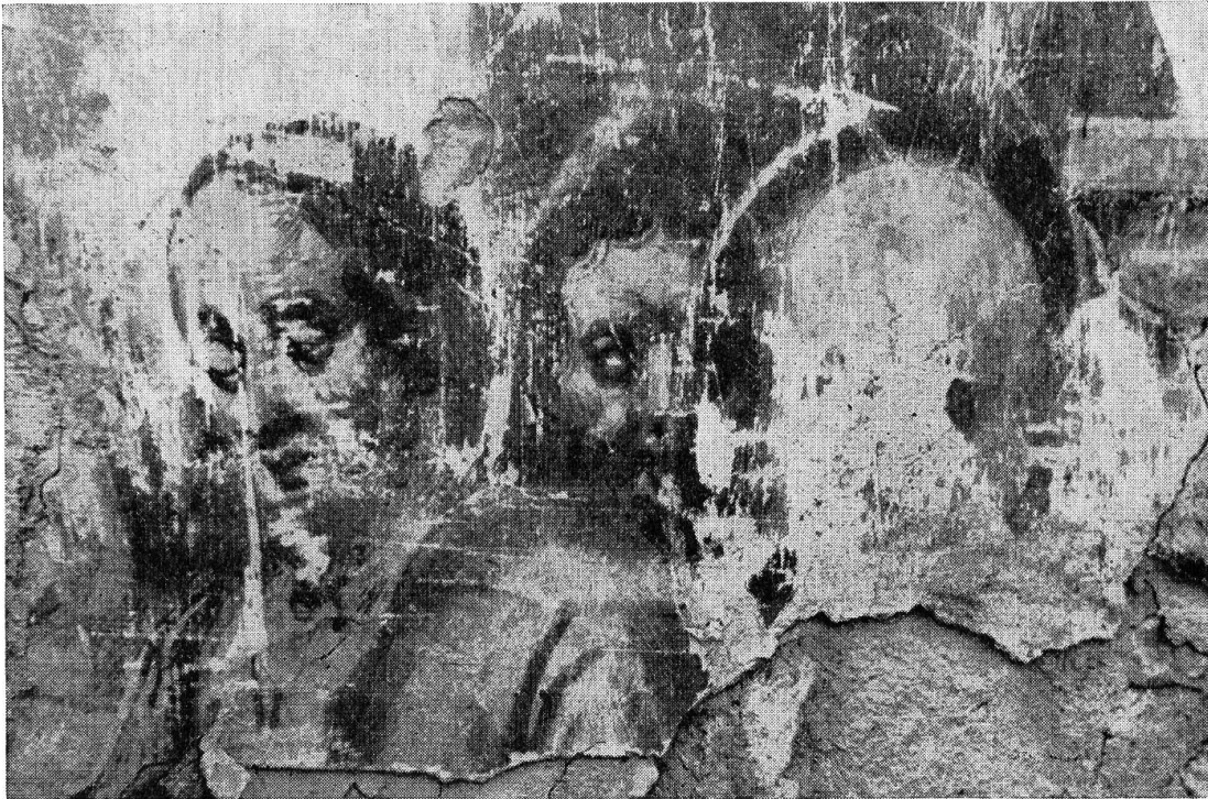
Abb. 9. Wandbild-Detail aus der alten Kirche Zuchwil. Aus der Passion Christi (Westwand des Schiffes)

mit Zuchwil vergleichen. Der einzige Name, der in diesem Zusammenhang genannt werden kann, ist der von Hans Bock d. Ae. Er befand sich Anfang des 17. Jahrhunderts in Solothurn 16 . Hier malte er nicht nur für die Kapuziner (Altarbild im Mönchschor), sondern auch für das St. Ursenstift. Dieses besaß aber die Kollatur von St. Martin in Zuchwil, und dessen Kaplan wohnte im Stiftsbezirk. Freilich, nach Pausen und Photographien lassen sich nachträglich keine sicheren Schlüsse mehr ziehen. Wenn nicht ein Aktenhinweis den Tatbestand erhellen kann, werden wohl die verlorenen Wandbilder von Zuchwil für immer auch anonym bleiben.