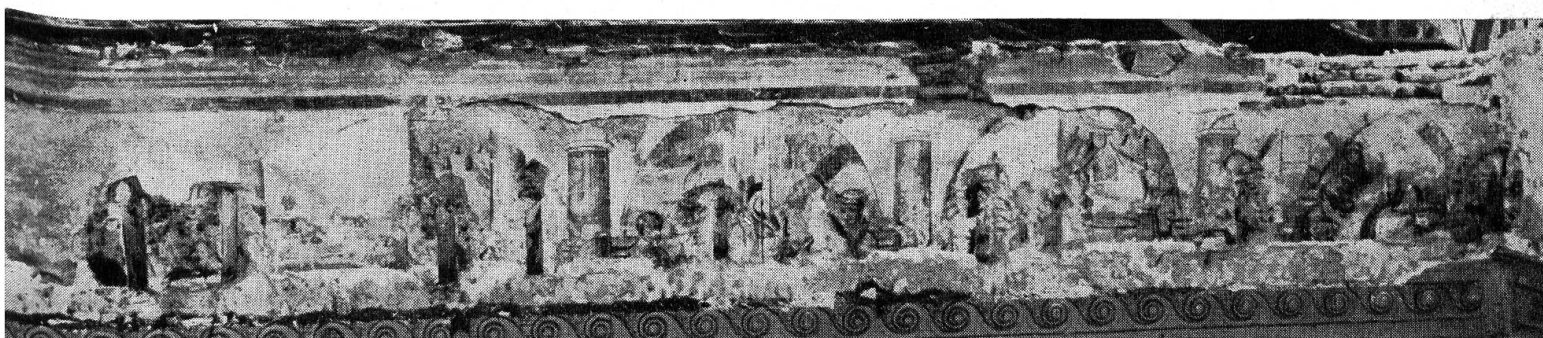
Abb. 10. Wandbild-Fries aus der alten Kirche Zuchwil. Aus der Vita des hl. Martin (Südwand des Chores)

1740, beim Einbau der neuen, prachtvollen Altäre, wurde der Bilderzyklus vermutlich übertüncht. Erst im 19. Jahrhundert, als man der alten Kunst nichts Ebenbürtiges mehr zur Seite stellen konnte, hieb man den Verputz mit den kostbaren Malereien herunter. Doch sind wir dankbar, daß wenigstens