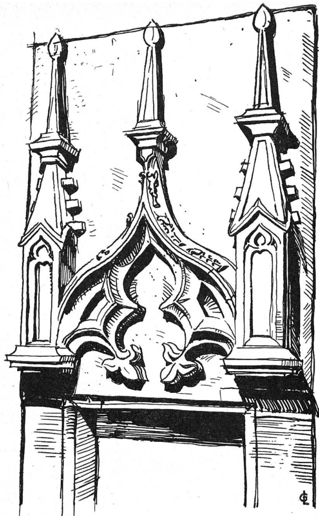
Abb. 8 (rechts). Gotisches Sakramentshäuschen (Ende 15. Jh.), nun in der Taufkapelle der neuen Kirche.

Altarblocks hervor. Normalerweise wurde nach Norden erweitert, und wenigstens die Fundamente der Südmauern blieben bestehen. Der Stipes von einem Meter Breite ist etwa ebenso viel von der Südwand entfernt. Das heißt, daß der Chor ca. 3 Meter breit war. Aus Analogie zu den kürzlich festgestellten Fundamenten der ältesten kirchlichen Anlagen in Lüßlingen, Messen und Oberdorf (alle in der Nähe Solothurns) dürfte es ebenfalls ein rechteckiger Saal mit eingezogenem halbrundem Chorschluß, also einer Apsis, gewesen sein.