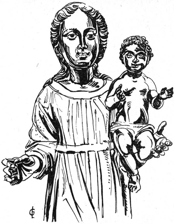
Abb. 7. Kopie des Einsiedler Gnadenbildes in der Kirche Zuchwil, von Joseph Kälin, um 1710.