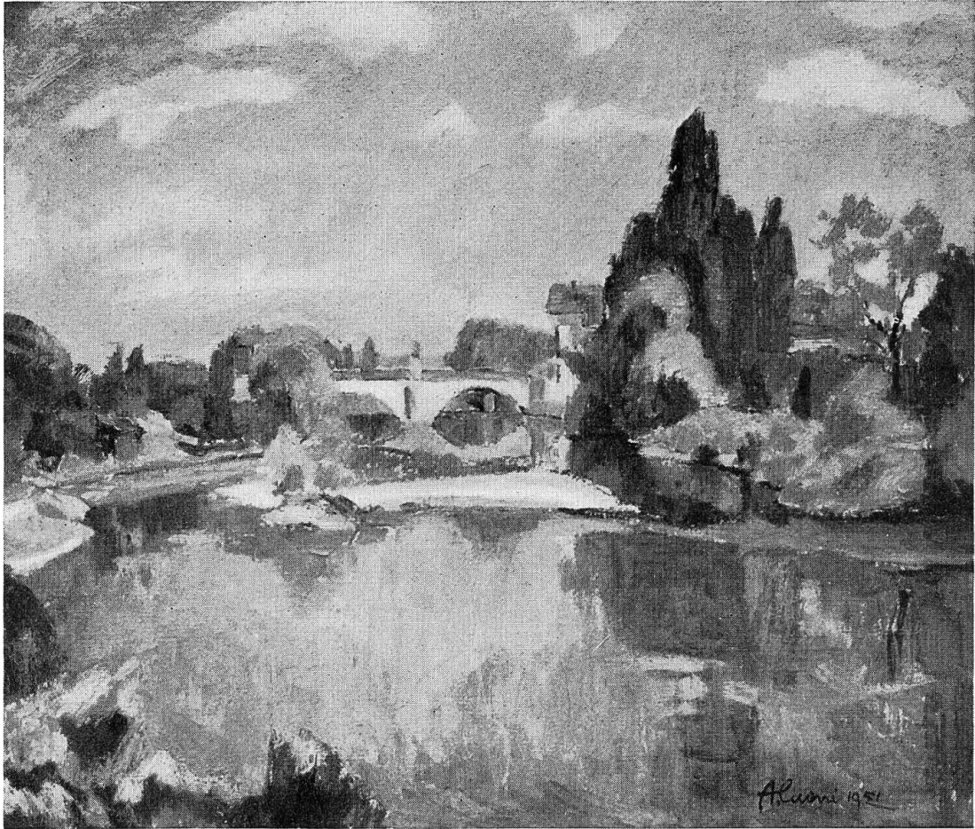
Abb. 12: Die Birs oberhalb der Brücke von Dornach. Oelbild von A. Cueni, 1951

seltene Alpenblumen in Geröll und Felsen aufzusuchen und auf der Leinwand festzuhalten, als wäre es etwas Selbstverständliches.