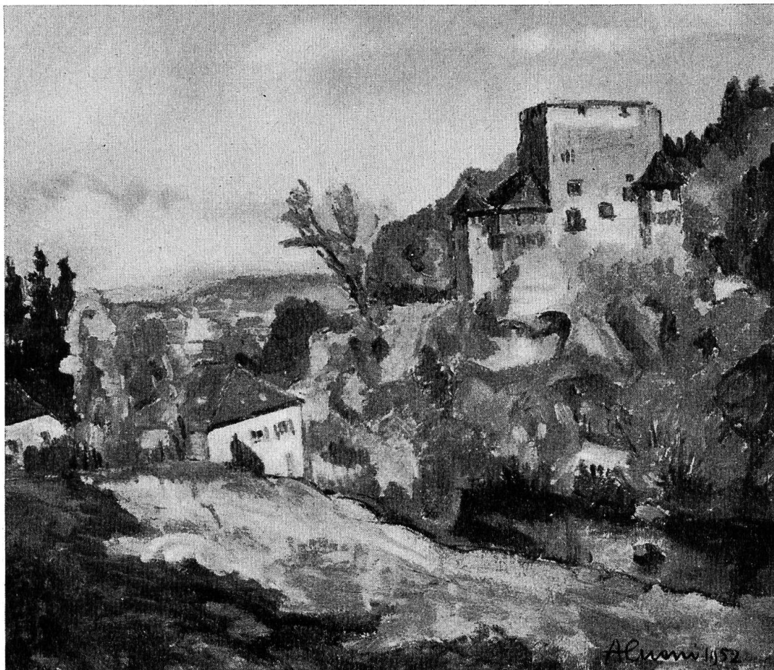
Abb. 11: Schloß Angenstein. Oelbild von A. Cueni, 1952

Daß er auch duftig zarte Motive seiner Palette entlocken kann, das bezeugen seine Blumenstilleben. Er läßt es sich nicht nehmen, im Lötschental