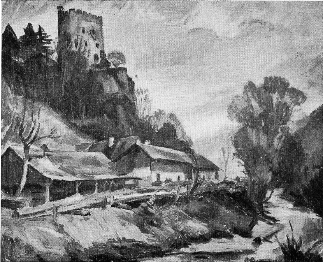
Abb. 10: Ruine Thierstein. Oelbild von A. Cueni, 1956