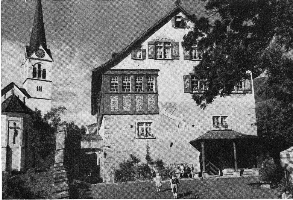
Mädchenerziehungsheim Burg, Rebstein (St. Gallen)

Das Heim wurde 1949 nach den Erfordernissen neuzeitlicher, familiärer Erziehung umgebaut und eingerichtet, wobei jedoch darauf Bedacht genommen wurde, dem ganzen Gebäudekomplex den historischen Charakter zu erhalten