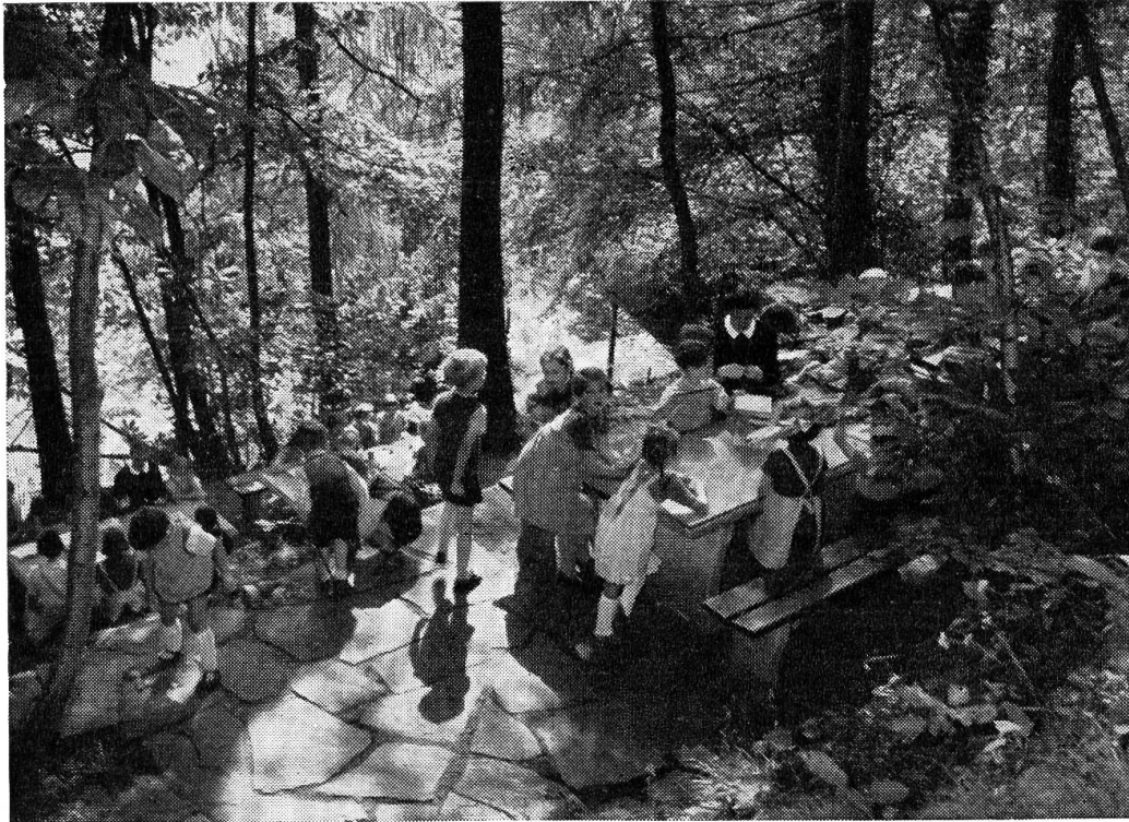
Präventorium Villa S. Teresina, Bombinasco (Tessin)

Das im walddreichen Hugelgebiet des Malcantone in prachtiger Sudlage befindliche Preventorium, umgeben von reichen Kastanienwaldern, Weingarten und bluhenden Matten, hat schon Tausenden kleiner Rekonvaleszenten und tuberkulosegefahrdeter Kinder volle Genesung und Kraftigung ihrer Gesundheit geschenkt. Hier sehen wir die Kurkinder beim frohen Spiel im ausgedehnten Park