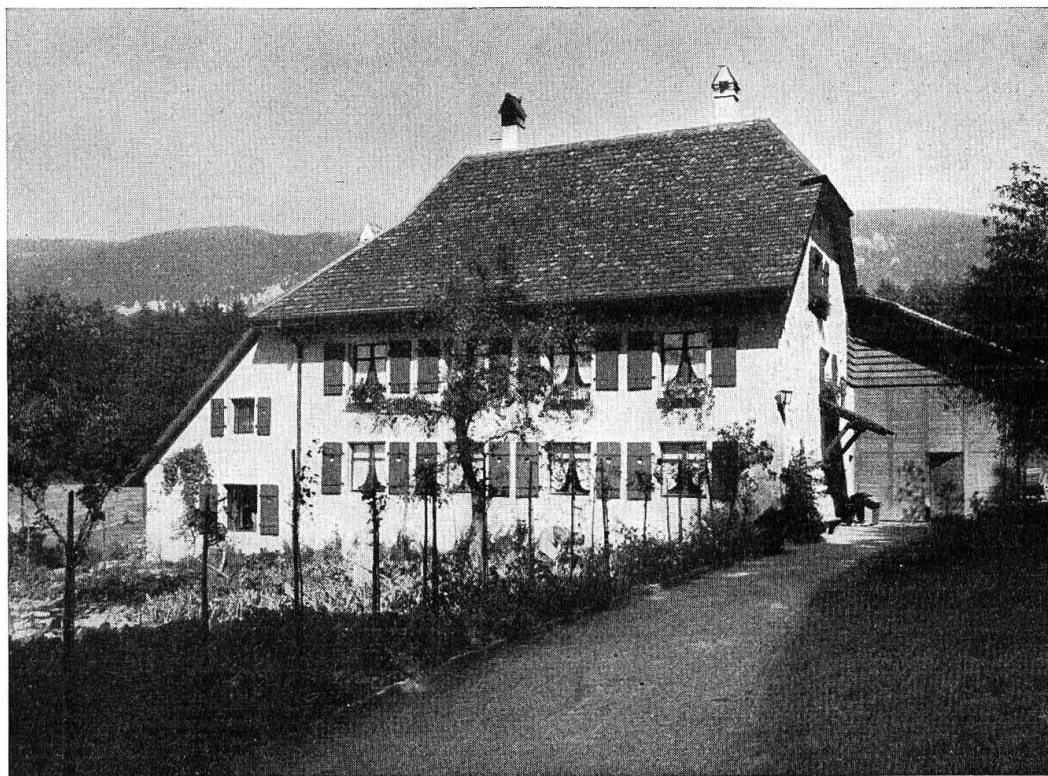
Waldhöfli, Rüttenen (Solothurn)

Das zweite große Arbeitsfeld des Seraphischen Liebeswerkes Solothurn ist die geschlossene oder Heimfürsorge . Bevor wir auf die einzelnen Niederlassungen eingehen, möchten wir vorausschicken, daß in allen unseren Heimen im Hinblick auf eine möglichst individuelle Erziehung das Familiensystem eingeführt ist. Die Zöglinge sind in kleine Gruppen aufgeteilt, die durch eine Erzieherin mütterlich betreut werden. Jede Gruppe hat ihre eigene Wohnung (das Zimmer der Fürsorgerin, die Schlafzimmer der Kinder und die Gruppenwohnstube), in der sich das Familienleben der kleinen Gemeinschaft abspielt.