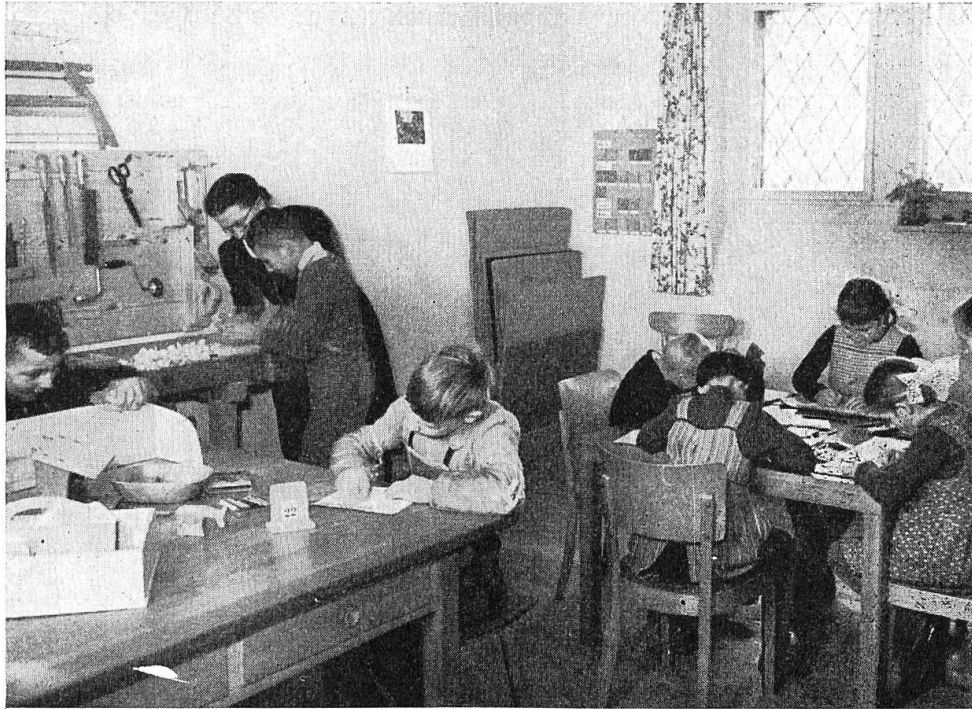
Heilpädagogische Beobachtungsstation Oberziel, St. Gallen

Dem Basteln und handwerklichen Schaffen kommt im Beobachtungsheim eine wesentliche Bedeutung zu. Hier darf das Kind schöpferisch tätig sein, wobei es in seinem Tun mehr als anderswo sein eigentliches Sein offenbart