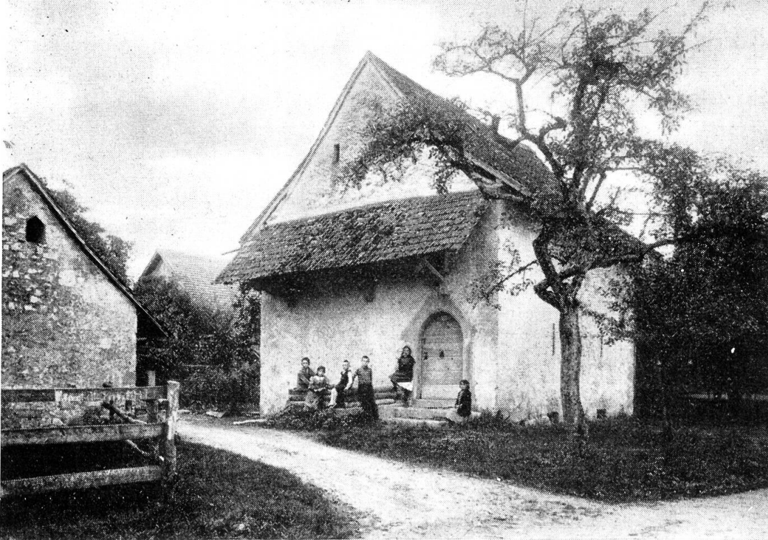
Einer der seltenen gemauerten Speicher im Kanton, der alte Zehntstock von Däniken Alte Aufnahme (1587)

Aber auch den Froburgern war es nicht beschieden, ein geschlossenes und straff regiertes Fürstentum zu errichten, ihre Lehensträger (Bechburger, Falckensteiner) und Ministerialen (z. B. die Herren von Olten, Ifenthal, Hagberg, Winznau, Wangen, Trimbach, Adlikon bei Wisen) durch Beamte zu ersetzen und damit die partikularistischen Kräfte zu überwinden. Wie für die großen war auch für diese kleinen Herren die Zeit vorbei. Die Zukunft gehörte diesseits des Rheins einem neuen Stand, dem städtischen Bürgertum.