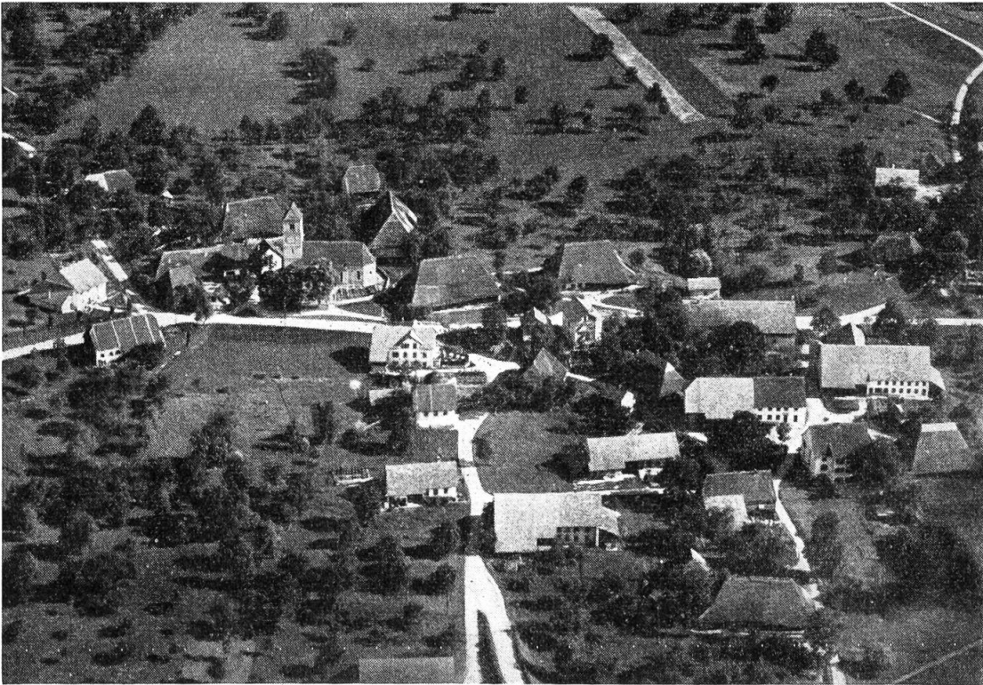
Flugaufnahme von Oberbögen, 1923/24, auf der man noch 10 Stroh Häuser entdeckt

Welches sind nun die «Baumeister» des «modernen Staates» ? In Frankreich und England verlief die Entwicklung zugunsten der Krone. Im Reich, wozu auch der schweizerische Raum gehörte, setzte sich der Einzelstaat durch: der fürstliche, aus weltlicher oder geistlicher Wurzel, vor allem jenseits des Rheins, der genossenschaftliche in der Urschweiz, der Stadtstaat in der übrigen Eidgenossenschaft.