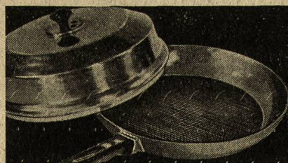
Grillbratpfannen mit Haube

Aktiengesellschaft für Leichtmetallwaren BELLACH/SO