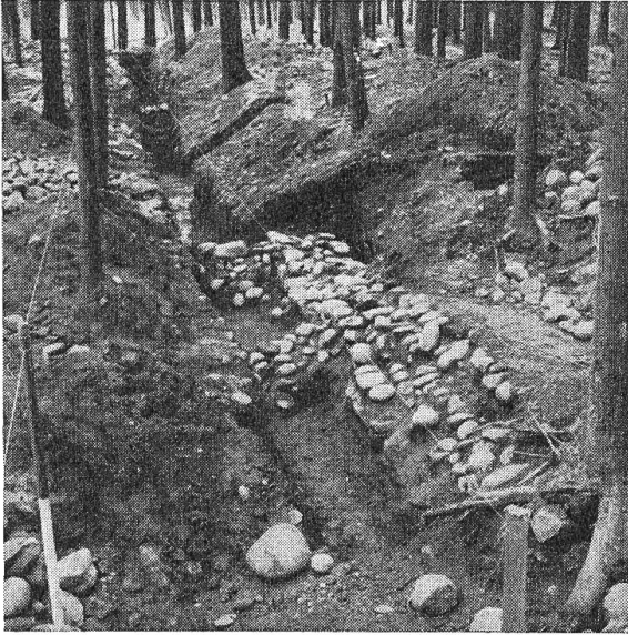
Abb. 3. Attisholzswald, Sondierung 1958: Der Schnitt parallel der südl. Portikusfundamente. Blick nach Westen.

in der Mitte der Portikus. Es ist kaum anzunehmen, daß der Westflügel erst später in zwei Räume unterteilt worden war.