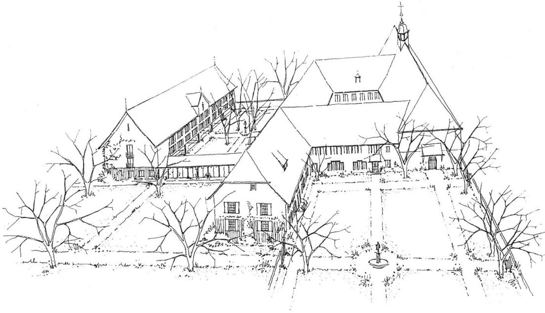
Solothurn. Das Kloster St. Joseph mit dem von der Denkmalpflege vorgeschlagenen Erweiterungsbau für neuzeitliche, sonnige Zellen

drängte, daß die Schwestern sich einer festen, von der Kirche approbierten Ordensregel unterzogen.