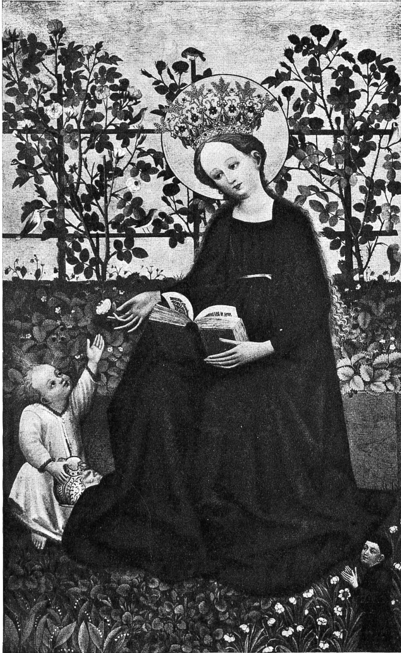
Solothurn, Die «Madonna im Rosenhag», ein Meisterwerk der Ober- rheinischen Schule (um 1410), ehemals im Kloster St. Joseph, jetzt in der Kunstsammlung des Museums Solothurn