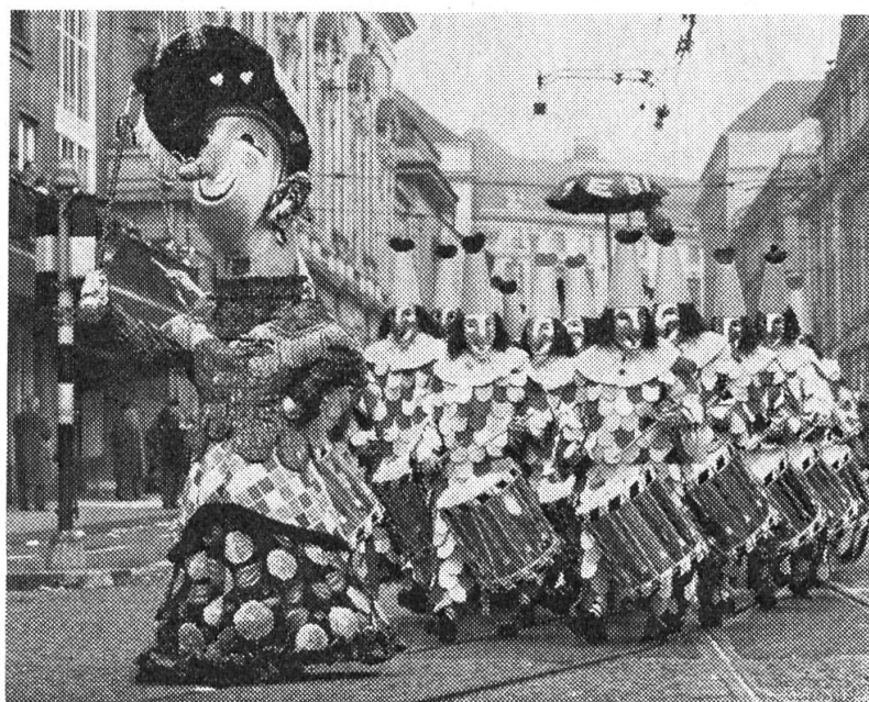
Die Photos stammen von der Basler Fasnacht 1961.