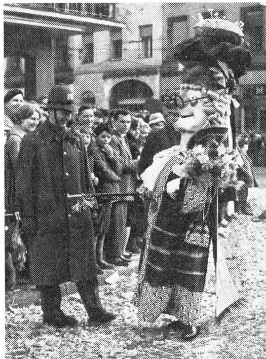
Tambour-Major der «Wettstai»-Clique

resp. Pfeifermarsch produzieren. Die einzelnen Trommelnummern werden unterbrochen, oder besser miteinander verbunden durch ein eigentliches Fasnachtliches Rahmenspiel, das in geistreichster Form die Geschehnisse des Jahres glossiert.