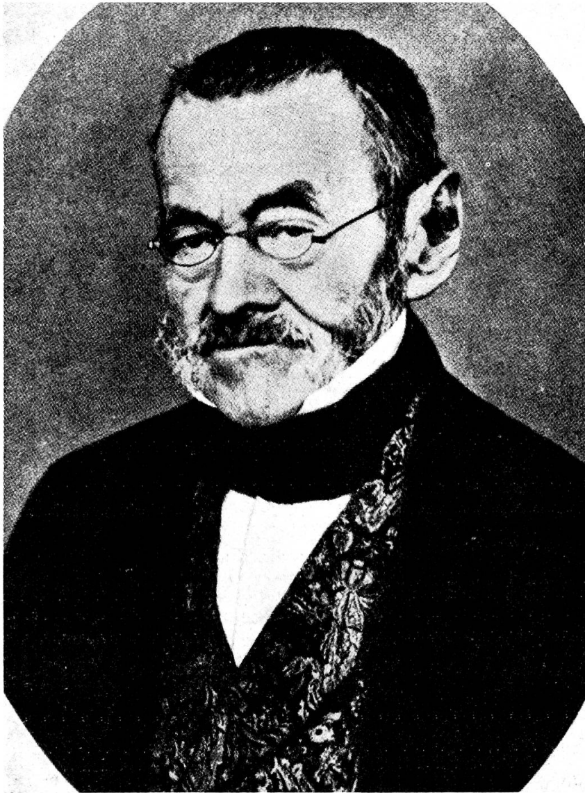
Einziges Originalphoto Sealsfields vom Solothurner Photographen W. Rust

brachte ihm sein erster Roman «Tokeah or the white Rose», eine Indianergeschichte à la Coopers Lederstrumpf, in der er zugleich Propaganda für die Demokraten machte, grossen Erfolg, so dass er 1829 nördlich von New-Orleans eine Plantage mit 8 Negersklaven kaufen konnte, ein Erwerb, der ihm später oftmals den Schimpfnamen «Sklavenhalter» eintrug. Er blieb indessen nicht dort, sondern begab sich nach New-York als Mitarbeiter zweier Zeitschriften. Hier knüpfte er Beziehungen zu dem damals in Amerika weilenden Joseph Bonaparte und den Bonapartisten überhaupt an, in deren Dienst er nun für rund zwei Jahrzehnte trat. Als bonapartistischer Agent kehrte er Ende 1830 zum