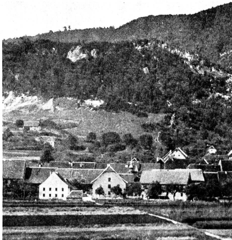
Alte Scheune zum Wohnhaus umgebaut 1863. Mitte: Mühle Rechts: Holzstoff-Fabrik

Die Gebäulichkeiten der Mühle scheinen in einem primitiven Zustand gewesen zu sein. 1581 liess der Besitzer Germann Walser durch Maurer und Zimmerleute einen Riss (Plan) über die notwendigen Reparaturen an Mühle, Haus und Scheune erstellen und wünschte beim Vogt das nötige Bauholz dazu. Dieser berichtete an die Regierung «die Mühle sei gar baulos, dass im Falle, dass man nichts dazu täte, sie dem Erdboden gerichtet würde». Dem Bittsteller wurde Bauholz in der Lebern und im Holz gegen Holderbank angewiesen. Im folgenden Jahre bat Walser die gnädigen Herren um Ziegel, damit er das Haus decken und den innern Ausbau ausführen könne; ohne diese Beisteuer könne er den Werkleuten keine Zahlung machen. Da ihm dieser Umbau viel Geld kostete, ersuchte er die Regierung auch, den Mühlezins zu reduzieren.