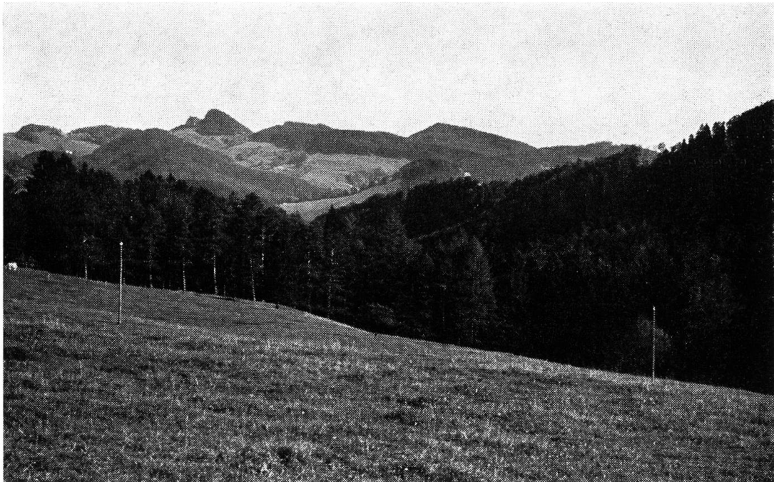
Abb. 2. Blick von der Waldweid gegen das Belchen-Gebiet

Die Vielfältigkeit und die Bedeutung des Belchen-Passwang-Gebietes kann am ehesten dadurch belegt werden, dass in über 260 Publikationen Material darüber zu finden ist. Die Kriterien, die das Gebiet als Landschaft von nationaler Bedeutung definieren lassen, können so gefasst werden: Das Belchen-Passwang-Gebiet ist eine hervorragende Typlandschaft des östlichen Kettenjuras. Dank der verschiedensten naturräumlichen Bedingungen hat sich in dieser alten und recht ursprünglichen Kulturlandschaft des Hochjuras eine reich gegliederte Vegetation mit Buchen- und Tannenwäldern ausbilden können. Ausserdem sind einzigartige Pflanzen, Standorte mit Bergbuschwald und artenreiche Felsfluren von hoher Bedeutung. Eine reiche Tierwelt belebt diese Gegend; es seien nur die Kolkkraben und die Gamsen genannt. In dieser tatsächlich harmonischen Landschaft liegen wertvolle Baudenkmäler eingebettet. Vom wissenschaftlichen Standpunkt aus gesehen, rechtfertigen die naturkundlichen und die kulturhistorischen Kriterien den Schutz dieser Landschaft. Zu diesen beiden Punkten kommt noch ein drittes und sehr wesentliches Moment: Das ganze Gebiet ist als Wandergebiet von hoher bioklimatischer Bedeutung zu bewerten. Das Besondere an diesem Wandergebiet liegt darin, dass der Erholung suchende Mensch einen freien und ungestörten Blick von den verschiedenen Aussichtspunkten aus geniessen kann (vgl. Abb. 3). Das Belchen-Passwang-Gebiet wird sowohl von der