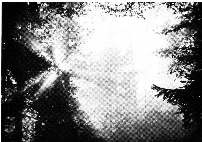
«Balmbergwoche», Durchbruch der Sonne.

auch in der «höchsten» Schule des Kantons willkommen zu heissen.» Dabei schweiften die Blicke über die Glut des Herbstwaldes und über das weite Nebelmeer zu den fernen Alpen hin.