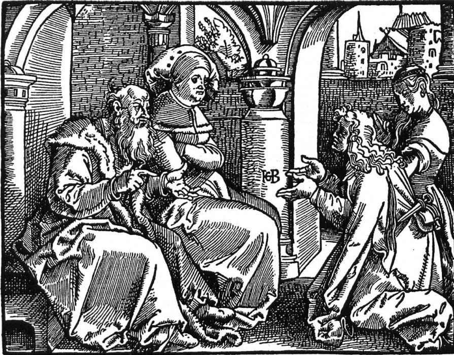
Das fünfte Gebot. Holzschnitt von Hans Baldung Grien. 1516.

von Baldung Grien geschmückt. Unter der Meisterhand des Künstlers wird die Illustration zu den Zehn Geboten durch neue figürliche und räumliche Erfindungen in eine zeitgemässe Vorstellungswelt umgewandelt. Die Versinnbildlichung der Gebote bekommt nun einen frischen Zug. Baldungs Holzschnitte sind wiederholt verwendet worden, zum Beispiel bei den Predigten von Geiler von Kaysersberg, was die Beliebtheit der Bilderfolge unterstreicht. Noch bis 1543 hat die Strassburger Buchkunst diese Druckstöcke für Predigt- und Bibelpublikationen benützt, eine Brücke schlagend zwischen Mittelalter und Neuzeit. Dieses Weiterleben verdanken die Holzschnitte der Anschauungskraft Baldungs.