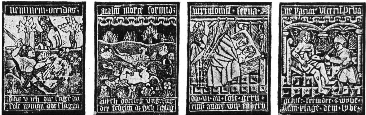
Darstellungen der Zehn Gebote und der ägyptischen Plagen. Oberrheinische Metallschnitte. Um 1475.

nung erhält. Bei der zweiten Bilderfolge in Heidelberg handelt es sich lediglich um Federzeichnungen in groben Zügen, welche vermutlich als Vorlage für die Ausführung im Holzschnitt dienten. Der Stil entspricht durchaus demjenigen der sogenannten Heiligen- oder Kartenmaler. Kristeller und Weisbach zählen die beiden Werke zu den frühesten, um 1450 zu datierenden Arbeiten dieser Gattung. Etwas später, wohl um 1475, dürfte ein ebenfalls oberrheinischer Metallschnitt entstanden sein, der zwanzig hochrechteckige Bilder in fünf Reihen zu doppelten Paaren zeigt. Das Blatt wird heute im Britischen Museum aufbewahrt. Jedem Gebot geht eine Darstellung der entsprechenden ägyptischen Plagen voraus, eine Konkordanz, die auf Augustinus zurückgeht. Oben sind die Bilder mit lateinischem Begleittext versehen, während unten eine zweizeilige deutsche Inschrift hinzukommt. Immer wieder erscheint im Hintergrund Moses als Halbfigur mit den Gesetzestafeln, den Ursprung der durch Gott verheissenen sittlichen Gesetze symbolisierend. Die Feststellung, dass wiederum Basel oder Strassburg die Heimat der Blätter ist, beweist die wichtige Rolle, welche diesen beiden Städten für die Verbreitung der paränetischen religiösen Darstellungsreihen zukommt. Im Gegensatz zu der betonten Umrisszeichnung bei den Holzschnitten arbeitet der Künstler hier in Anpassung an die Technik des Metallschnittes im flächigen Tiefdruckverfahren unter Verwendung des Rappports.