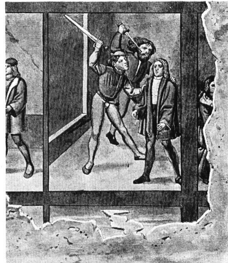
Darstellungen der Zehn Gebote. Aquarellkopien nach Standbildern in der Pfarrkirche von Muttenz. Um 1507.