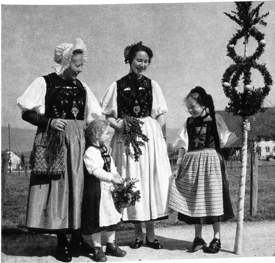
Palmsonntag in Dulliken im Solothurner Niederamt