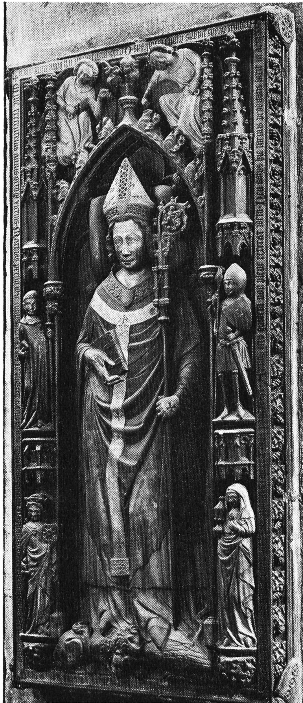
Grabdenkmal für Erzbischof Matthias von Buchegg † 1328 im Dom von Mainz

Erst 1337, wohl 75jährig oder mehr, kehrte Graf Hugo von Buchegg endgültig in die Heimat zurück. Zweifellos mehr aus politischen und praktischen Gründen entschloss er sich in diesem Greisenalter noch zu einer zweiten Hei-