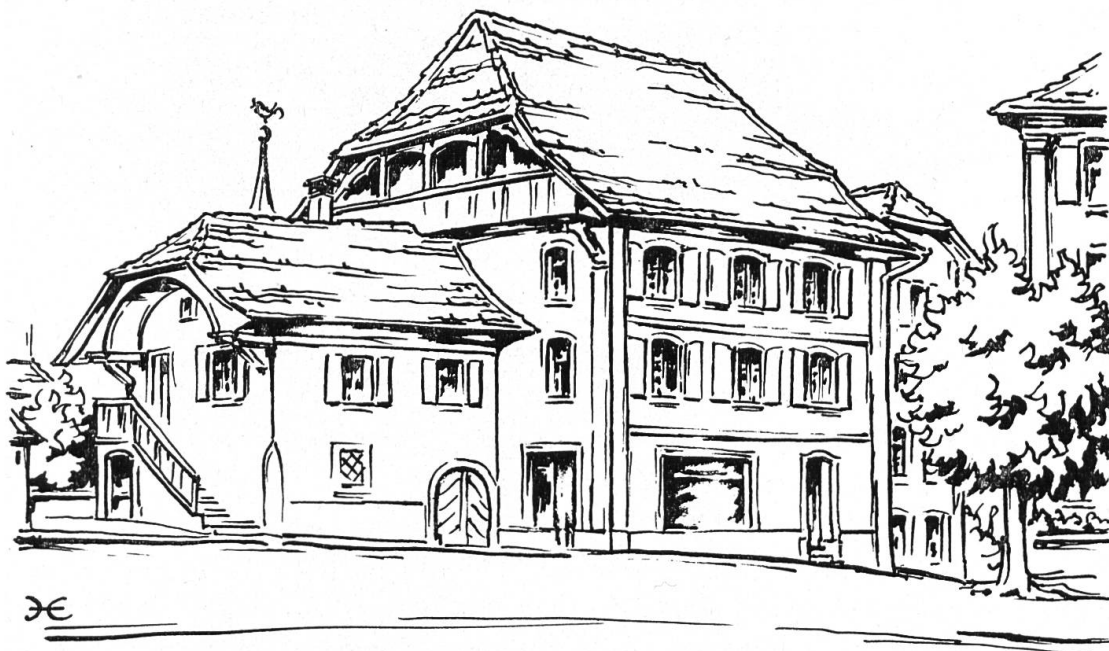
3 Hug'sches Haus in Sissach, links die alte Wache

In eine weit spätere Zeit führt uns Abb. 3 — zum grossen Hug'schen Haus in Sissach und, links daneben an der Diegterbachbrücke, zur alten Wache. Was wäre Sissach, trotz einiger sehr schöner Denkmäler, ohne diese markante Baugruppe mit Hauptstrasse 88 und Rheinfelderstrasse 1: Dieses verspätet-barocke Gebäude von 1807 wird nicht nur durch Ecklisenen und