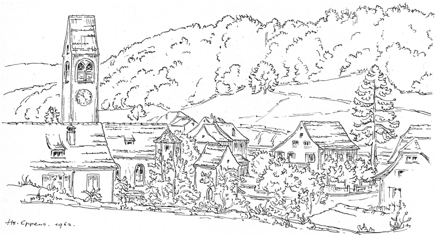
2 Rümlingen, Dorfzentrum

meist traufseitig zur Strasse. Bei zweien der hier abgebildeten Dorfzentren ist nun aber gerade nichts von dieser Aufreihung zu sehen. Das hier abgebildete ältere Oltingen (Abb. 1, Ausschnitt aus einer Zeichnung C. J. Müllers) unterhalb der Schafmatt steht mit Kirche, Beinhaus, Pfarrhaus, Pfarrscheune — mindestens mit dem Kirchhof — fast wie eine Burg auf einem nordwestwärts steil abfallenden Geländesporn. Ein Chorfenster der Kirche trägt die Jahreszahl 1318, die Südtüre eine von 1474. Ob die den Gottesacker umgebende kniehohe Mauer einst Zinnen trug, ist fraglich; jedenfalls wird die Verbindungsmauer zwischen der Nordostecke der Scheune, vorne im Bild, mit der Südwestecke des Pfarrhauses, rechts, über einer Aufstiegs- treppe von einem Rundbogenportal durchbrochen. Ein kleineres sieht nord- (ost)wärts. Das einstige Beinhaus lehnt mit einem Pultdach an die einst völlig spätgotische Pfarrei. Ihre Giebel schmücken Treppungen, das heisst Zinnenrudimente. Unser Bild zeigt deutlich, wie auch Bäume zur Geschlossenheit der Ansicht beitragen können.