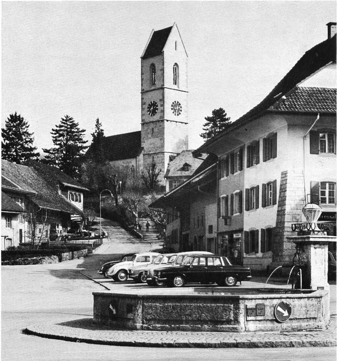
4 Gelterkinden, Dorfplatz mit Kirche

Quergurten gerafft, sondern zudem mit einer prächtigen vierachsigen Giebel- laube und hohem Krüppelwalm ausgezeichnet. Die nur einstöckige alte Wache hat eigenartigerweise, auch gegen Süden, eine kräftig vorspringende «Bernerründe» unter der Dachhaube erhalten.