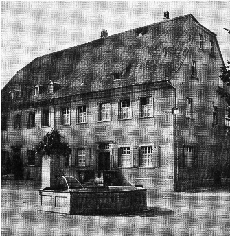
6 Domplatzbrunnen von Arlesheim; an der Ostwand Madonnenrelief von 1766

genden — an diesem grossartigen Domplatz sind reiner Hochbarock: Entwürfe vom Bischöflichen Architekten von Eichstätt, dem Misoxen Jakob Engel (Jacobo Angiolini); erbaut 1681—1687.