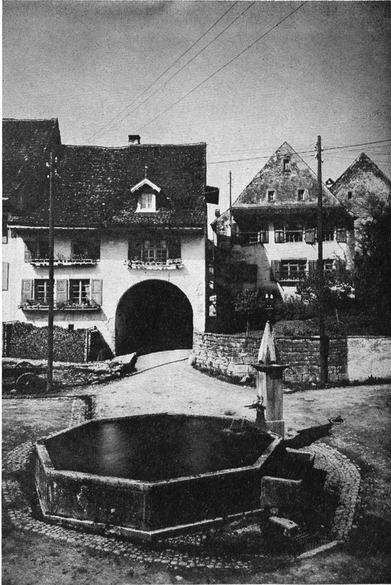
7 Dorfbrunnen von Wenslingen