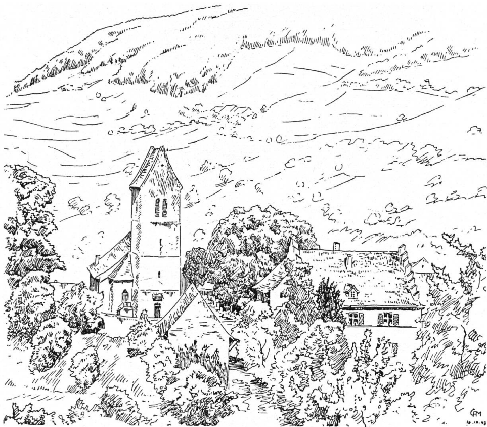
1 Kirche und Pfarrhaus Oltingen (nach C. A. Müller)