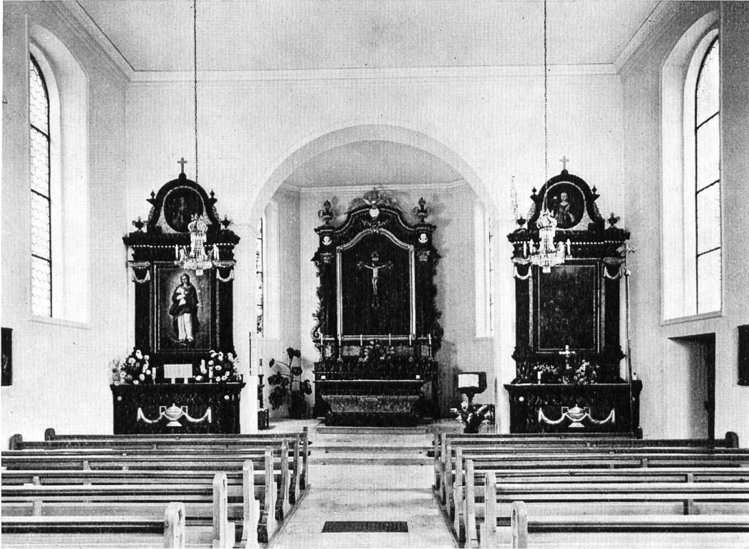
Himmelfried. Inneres der Kirche nach der Restaurierung.

zuversetzen, die Gipsdecken und den Chorbogen beizubehalten. Da der Hochaltar aus der Zeit später durch ein wertloses Retabel ersetzt worden war, die seitlichen Stuckaltäre jedoch bleiben und wieder mit den alten Bildern versehen werden sollten, besorgte die Denkmalpflege einen passenden Hochaltar des 19. Jahrhunderts, und zwar aus der alten Kirche von Härkingen. Das fehlende Bild fanden wir schliesslich in der Bettlacher Kirche, eine Kreuzigung, die jetzt restauriert und demnächst eingesetzt werden wird. Es war ein Wagnis, die Verkleidung des Altartisches vom Aufbau abzutrennen und den Volksaltar damit zu ummanteln. Das Resultat wirkt aber überraschend gut. Von der Denkmalpflege gestiftet ist auch der gemalte Stationenweg.