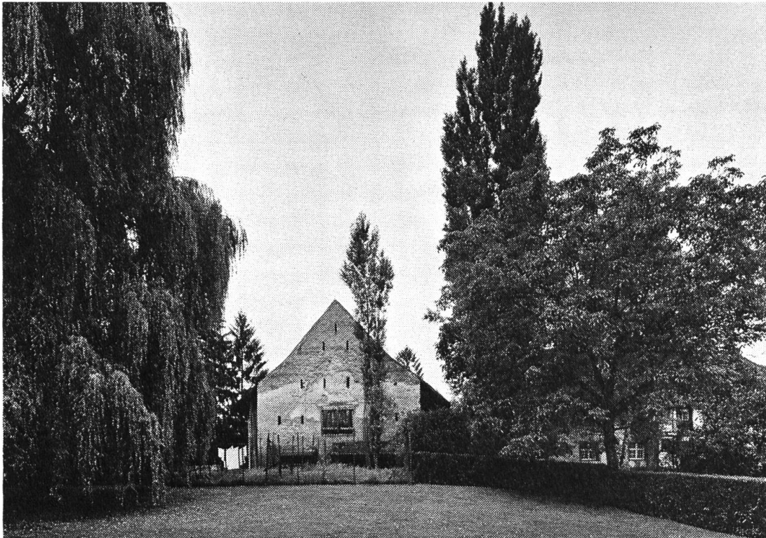
Die Scheune des Wenkenhofs in Riehen.

mie und müsste eigentlich tabu bleiben, auch schon deshalb, weil solche im Umkreis Basels als Gebäudetypen immer grösseren Seltenheitswert bekommen. Man wünschte dieser grossen alten Scheune demnach einen etwas weniger mondänen neuen Verwendungszweck.