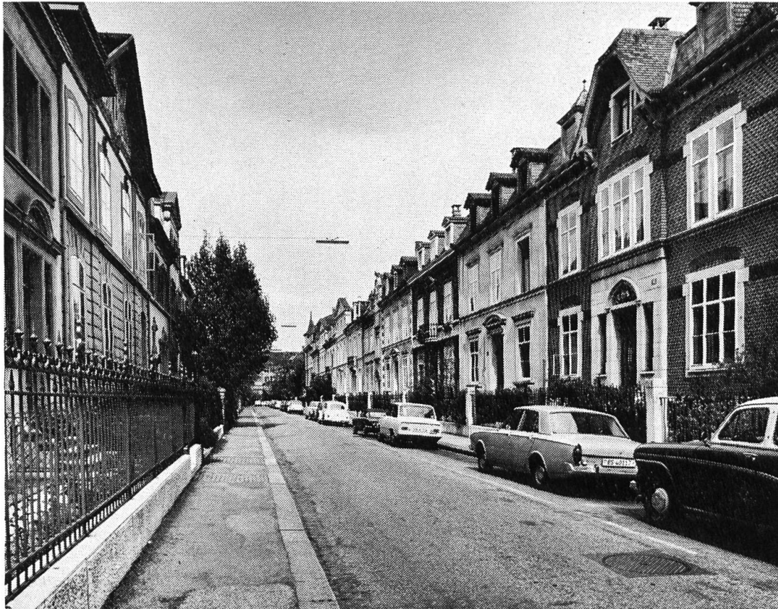
Die Angensteinerstrasse. Häuser von namhaften Basler Architekten des 19. Jahrhunderts erbaut. Unter Denkmalschutz gestellt.