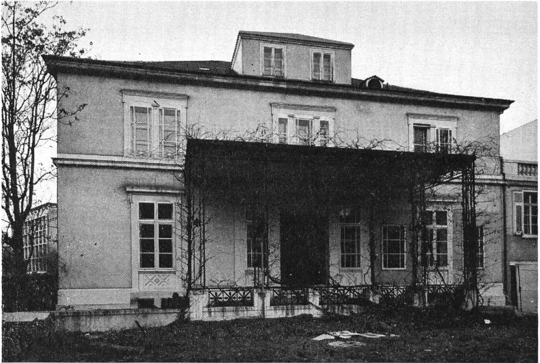
Villa an der Lautengartenstrasse. 1844 erbaut vom berühmten Architekten Melchior Berri.

einst Mittelpunkt jenes Landgutes, von dem noch heute das ganze Quartier seinen Namen trägt, und das nun einem Erweiterungsbau des Claraspitals zu weichen hat, und — als noch hervorragenderes Kunstwerk — das in edelsten Proportionen errichtete Landhaus an der Lautengartenstrasse des berühmten Melchior Berri (1844), das einer rationellen Neuüberbauung Platz machen musste. Die Denkmalpflege hatte in beiden Fällen noch Rettungsversuche unternommen, diese aber, da sie sich vorab aus finanziellen Gründen als gänzlich aussichtslos erwiesen, einstellen müssen.