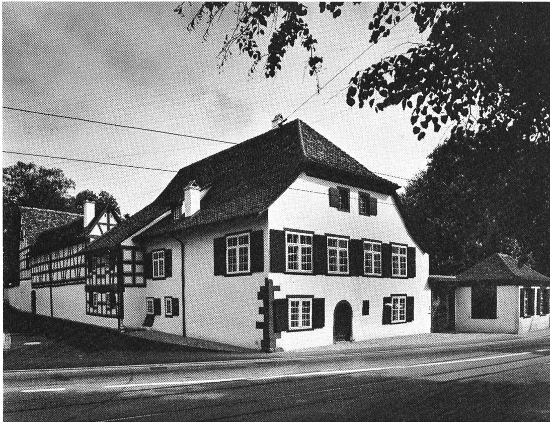
Der restaurierte Landsitz Bürgermeister J. R. Wettsteins in Riehen.

einmal zu einem Dorfbild gehört, konnten wir darauf nicht eintreten. Die Wiederverwendung solcher ausser Gebrauch stehender Bauten allerdings liegt im eigensten Interesse der Denkmalpflege. Wir machten daher den Vorschlag, die äusserliche Umgestaltung in zurückhaltendster Weise auf jene weniger prägnanten Seitenfronten zu beschränken.