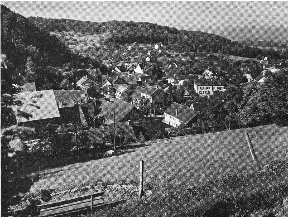
Das Dorf Bettingen.

als die Eulerstrasse, entstanden ist, haben die namhaftesten Architekten der damaligen Zeit mitgewirkt und bei allem Reichtum der verschiedenartigen Dekorationsformen eine eindruckliche Geschlossenheit des Strassenraumes erzielt, welche der beigezogene Gutachter, Prof. Dr. A. Reinle, Zürich, als einzigartig hervorhob. Ein im Grossen Rat eingereichter Anzug unterstützte dieses Denkmalschutzvorhaben gleichermassen. Mehrere Hausbesitzer indessen wollten sich jedoch mit der Unterschutzstellung ihrer Liegenschaft nicht abfinden und haben an das Verwaltungsgericht eine Beschwerde eingereicht. Die Vernehmlassung der Parteien in der Sache erfolgte im Berichtsjahr. Es bleibt das Urteil abzuwarten, welches über diesen Einzelfall hinaus von grosser grundsätzlicher Tragweite sein wird.