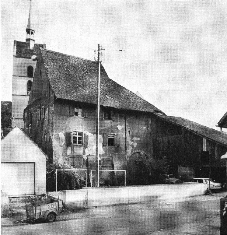
Der Meierhof in Riehen. Wohl ältestes Profan- gebäude des Kantons Basel-Stadt.

dert erbaute Lusthaus mit Parkanlage, das von Alexander und Fanny Clavel weiter ausgebaut und als fürstliches Geschenk der Basler Öffentlichkeit übergeben worden ist, waren sinnvolle Verwendungsmöglichkeiten auszudenken. Andere Fragen ergaben sich beim alten Wenken , jenem Sitz, der aus einem Bauerngehöft hervorging, welches bereits im Jahre 751 erwähnt wird. Diesen bäuerlichen Einschlag hat die stille, um einen Hof gruppierte Baugruppe durch alle Jahrhunderte hindurch behalten, er kommt in der ganzen Abfolge von Ökonomie, Remise, Pächter- und Herrschaftshaus zum Ausdruck. Zur Diskussion stand nun der Umbau der mächtigen Wenkenscheune — weiterhin die stattlichste, welche es noch gibt. Hier besteht der Wunsch, den einen Teil des Stall/Scheunentrakts in ein gehobenes Einfamilienheim umzugestalten. Ein Changement von derartiger Spannweite zieht naturgemäss auch umfängliche Öffnungsveränderungen mit sich. Insbesondere war vorgesehen, die massive, weithin sichtbare Giebelseite mit ihrer Hochteneinfahrt und den Luftschlitzen in eine gewöhnliche Fensterfront umzubilden. Damit liesse sich aber schwerlich mehr erraten, dass dies Gebäude ja die alte Schneune ist, welche in der Aufbaustruktur des Wenken ebenso wesentlich und unentbehrlich wie das Herrschafts- oder Pächterhaus. Die Giebelformation nämlich bildet ein Hauptcharakteristikum einer alten Ökono-