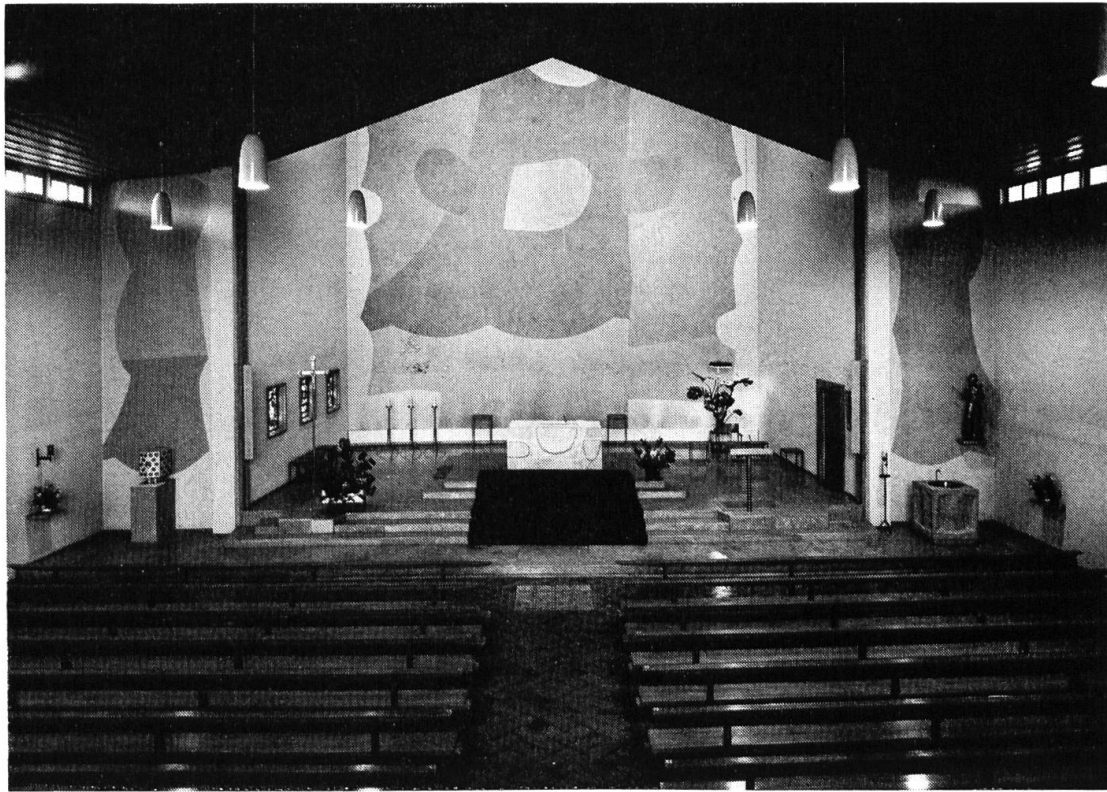
Inneres der St.-Martins-Kirche

magistra, Mutter und Lehrmeisterin sein und ihnen in guten und bösen Tagen einen Ruhepunkt für den suchenden und ringenden Geist, eine Nahrung für das Gemüt und ein Ansporn für den Willen zum Guten sein. Starke und Schwache, Gebildete und einfache Leute, Einheimische und Fremde sind gleich vor Gott und sollen bereit sein, einer des andern Last zu tragen. Diese schöne Gemeinschaft dehnt sich aus auf alle Christen, die wie wir unterwegs sind zum ewigen Leben und auf die gesamte Dorfschaft, zu deren Schönheit und Bedeutung die St.-Martins-Kirche mit Kapelle, Denkmälern und Anlage nicht wenig beigetragen hat.