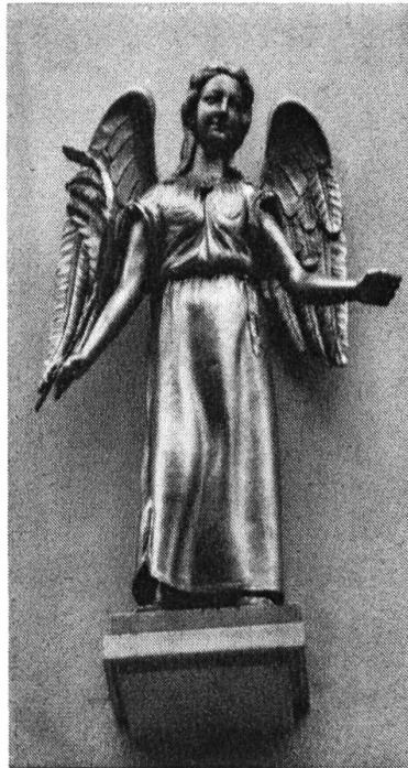
Spätklassizist. Engel an der Engelapotheke,