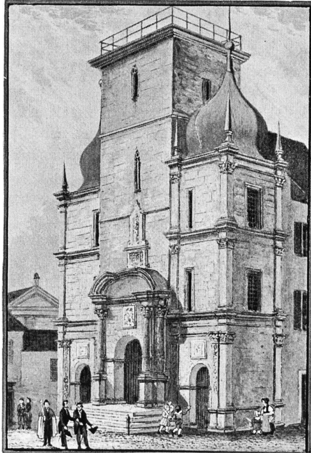
Aquatinta nach einer