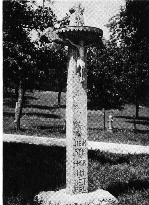
Das Kreuz in der Au von 1722 vor der Restaurierung