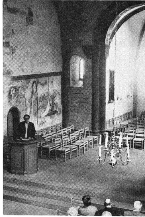
St.-Arbogast-Kirche MuttENZ: Blick in den Ostteil: Kirchenschiff mit Kanzel, Chor, Wandpfeiler mit vorspringenden Halbsäulen, Kreuzrippe, hinter dem Vortragenden Fresken.

liche Feudalburgen entstanden, die für den Berggrat namensgebend waren. Wie der Tagesreferent, der basellandschaftliche Denkmalpfleger Dr. Heyer , ausführte, ist unter diesem Gesichtspunkt auch die Befestigung der MuttENZer St.-Arbogast-Kirche zu verstehen: Der mit einem Zinnenkranz und zwei Tortürmen bewehrte 7 m hohe Mauerring wurde jedenfalls errichtet, als die Wartenbergburgen ihrer Funktion, ausser Sitzen des Adels auch Zufluchtstätten der Dorfbevölkerung zu sein, nicht mehr genügten. — Die Grabungen im Kirchengelände förderten viel Überraschendes zutage: Römische und jüngere Spuren liessen auf eine frühchristliche Kirche schliessen. Über ihren spärlichen Resten erhob sich ein romanischer Bau, dessen Westteil im Erdbeben vom St.-Lukas-Tag 1356 in Trümmer fiel. Sein Ostteil, ein längsrechteckiger Viereckchor, blieb erhalten. Er weist ähnliche Bauelemente auf, wie der romanische Teil des Basler Münsters, ohne dass die gleichen Bauleute durch Steinmetzzeichen bestätigt werden. Seine Decke wird von einem Kreuzrippengewölbe getragen. An einem Medaillon ist das Wappen der Münch-Löwenburg zu erkennen, an anderer Stelle das Allianzwapen der Münch-Eptingen. Diese Dekors erinnern daran, dass die Herrschaft MuttENZ, ursprünglich ein Teil des Elsass', später an die Münch überging, die sie mit ihren übrigen Gütern vereinigten. Einer der letzten des Geschlechts, Hans Thüring, liess den Glockenturm am Nordostteil des Schiffs errichten, bekrönt mit einem Satteldach (einer «Käsbiisse»).