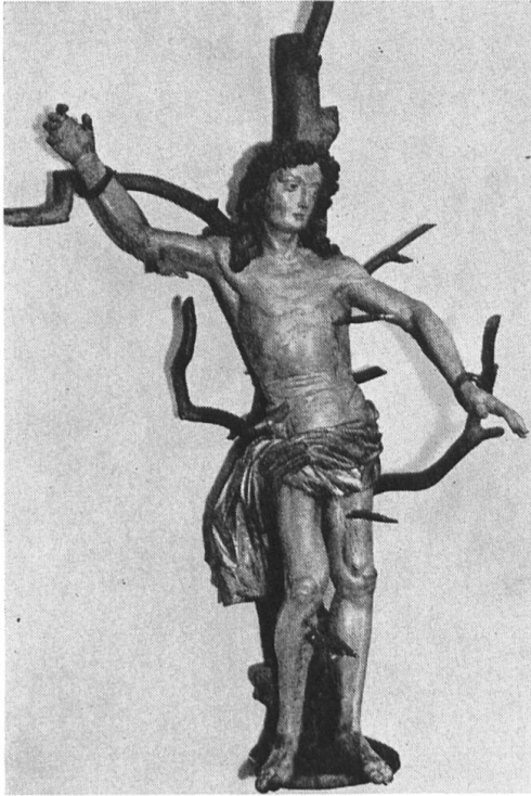
Therwil: St. Sebastian, 1550