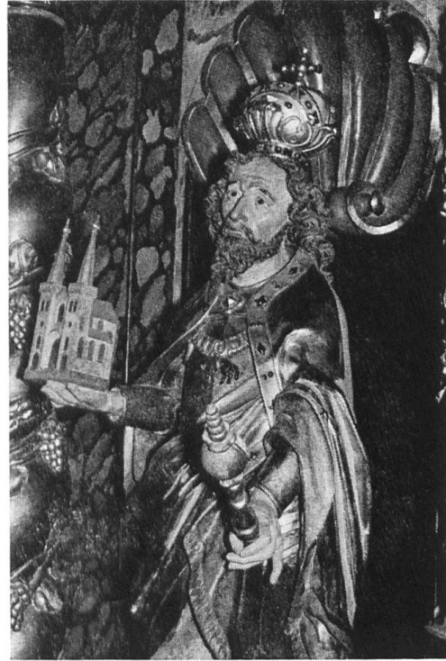
Therwil: Kaiser Heinrich II. am Hochaltar

kapelle, Renaissance-Türe und vorzüglichen Plastiken, alles publizistisch sehr gut dokumentiert, das viel zu wenig bekannte Kunstziel im Leimental. Ein Stündchen in St. Stephan muss für uns immer ein Genuss sein, schon wegen seiner Einmaligkeit aus der Zeit des Frühbarocks, dann auch durch die Mannigfaltigkeit und die vorzüglich erfolgte Restaurierung.