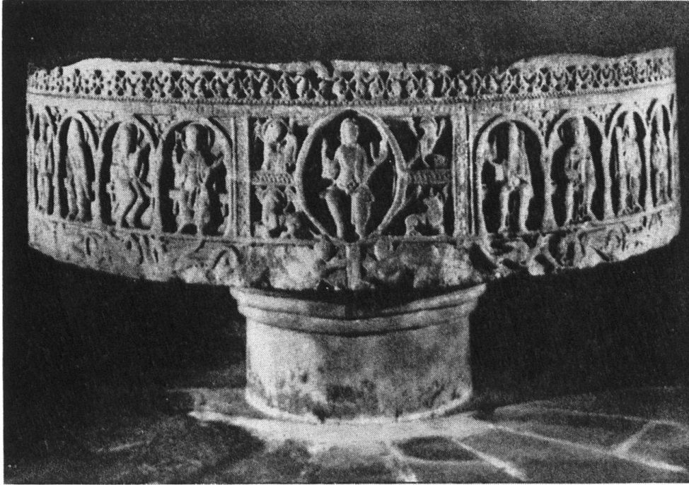
«Taufstein» aus St. Ulrich, offenbar unterstes Becken eines dreischaligen Brunnens, roter Sandstein, 11. Jh.