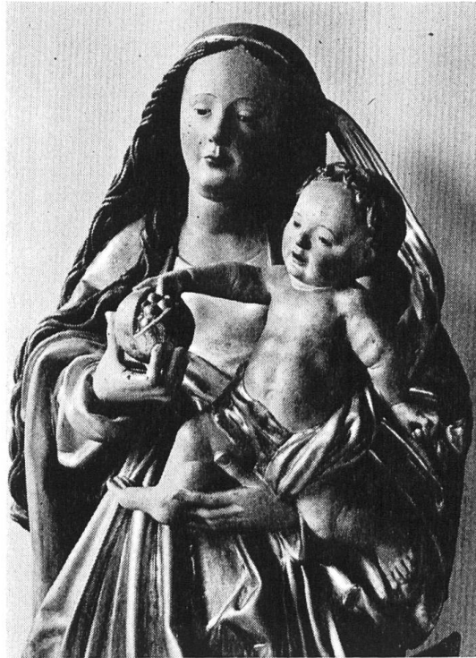
Laufen, St. Katharina: Spätgotische Madonna

Birsabwärts stehen die charakteristischen Wehrbauten des Wasserschlosses Zwingen , wo der neugegründete Schlossverein sich bemüht, fachgerechte Restaurationen zu finanzieren und der Öffentlichkeit vermehrten Zutritt zu verschaffen.