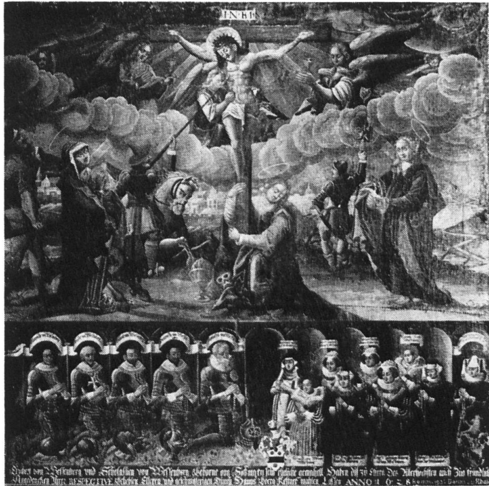
Burg im Leimental: Votivbild der Herren von Wessenberg, 18. Jh.

Elsass zu finden, während das Niellokreuz gar nach Leningrad in die Ermitage gelangte. — Ein lohnender Spaziergang führt zur Annakapelle mit polygonem Grundriss und Engelmalereien in der Kuppel.