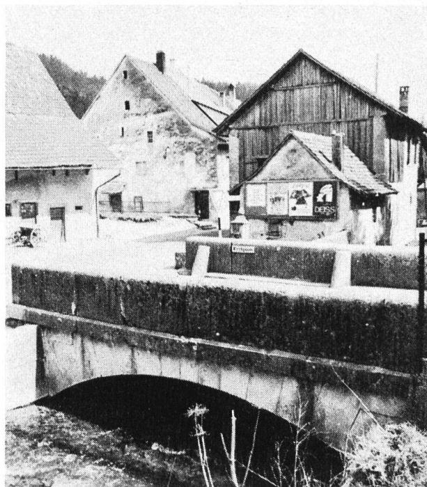
Ansicht des Waschhäuschens bei der Tumetenbrücke, um 1972. Dahinter angebaut das heute abgebrochene Magazingebäude des ehemaligen Bäckerei- und Spezereiladens «Stohler Beck».

Das Oberdorf-Buchhüsli gegenüber der Mühle musste dem Verkehr weichen und wurde 1967 abgebrochen 4 . Das gleiche Schicksal erfuhr auch dasjenige im Mitteldorf 5 vor dem Pfarrhaus. Als die Gemeinde