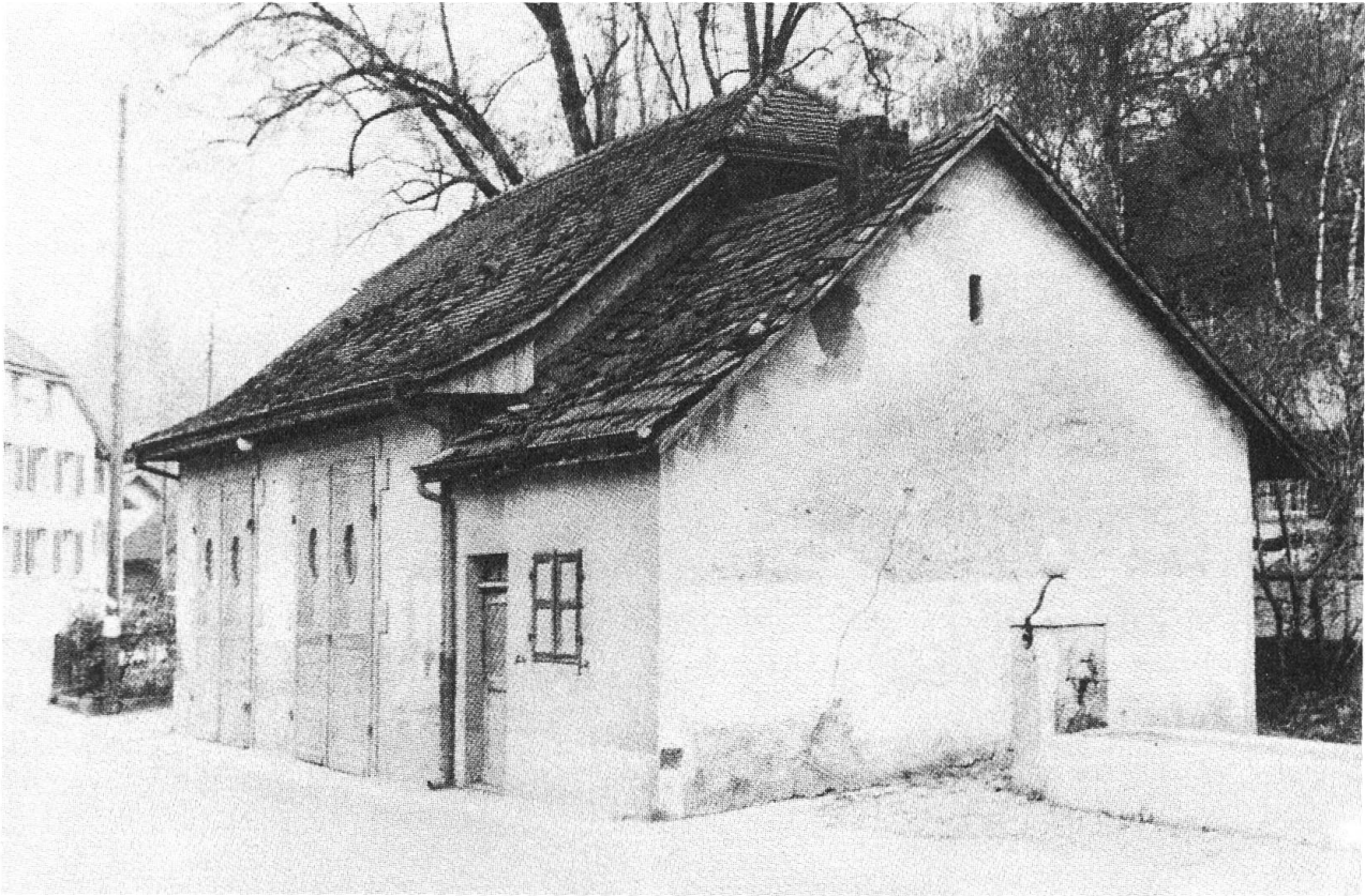
Waschhaus und Spritzenhaus im Mitteldorf, kurz vor dem Abbruch 1976.