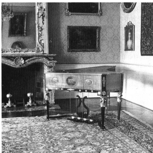
Schöfstossflügel 1810 im roten Saal.

Zu erwähnen wären noch die bedeutende Münzsammlung des Museums und die einmalige Weihnachtskrippe aus dem Besitz der Ambassadoren. Beide sind aber zur Zeit in Bearbeitung und deshalb leider vorübergehend nicht zu besichtigen.