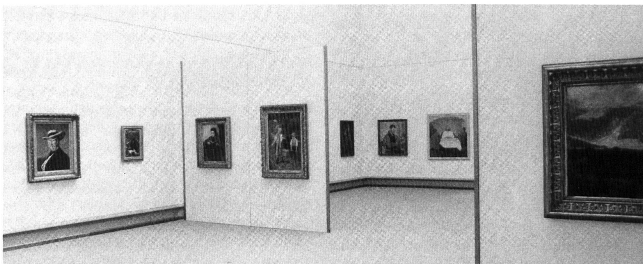
Kunstmuseum Solothurn, Saal 19. Jh..

Dieser Sammlungsteil ist neu entstanden durch die Übernahme der Stiftungen. Es handelt sich — von Klimt, Liebermann und Hofer abgesehen — um französische Kunst oder um Arbeiten von Künstlern, die in Frankreich arbeiteten. Von Renoir-Degas-Van Gogh führt die Gruppe über Cézanne-Matisse-Rouault-Utrillo zum Schaffen von Picasso, Braque, Léger und Gris. Leider fehlt die Plastik fast ganz.