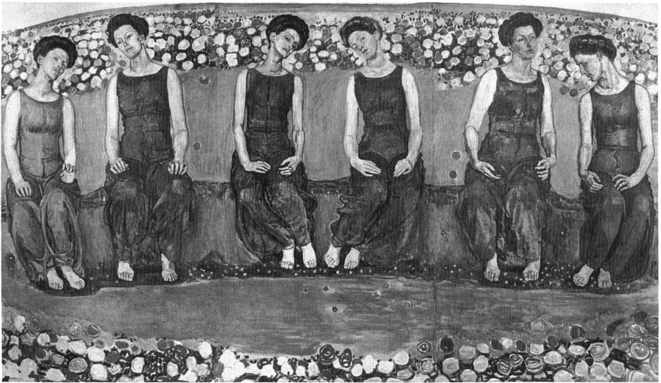
F. Hodler: Die heilige Stunde. Kunstmuseum Solothurn, Dübi-Müller-Stiftung.