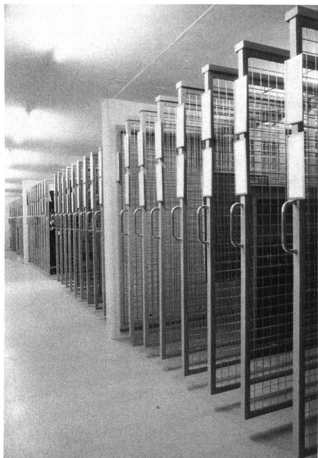
Kunstmuseum Solothurn, Kulturgüterschutzraum.

Die Beurteilung von Sammlung und Haus hat die Fachkommission und die Leitung des Kunstmuseums Solothurn zu den folgenden Schlüssen geführt: