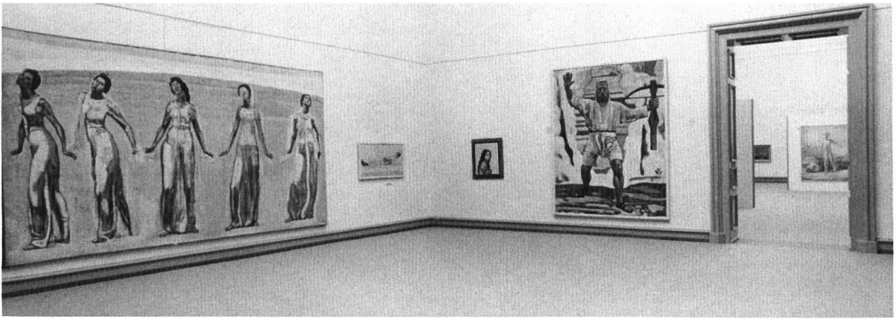
Kunstmuseum Solothurn, Saal Hodler. (Foto C. Leuenberger).