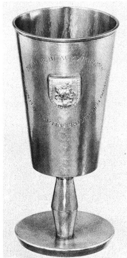
Der von den 1966 zu Martinsbrüdern ernannten Gesellen gestiftete zweite Obmannsbecher.

Jahre 1683. Diese Einträge, Pergamente und Bücher belegen ein zünftisches Leben in Olten, das sich für eine Kleinstadt durchaus sehen lassen darf. Es überrascht daher nicht, dass sich schliesslich wieder Männer fanden, die solche traditionelle Meisterschaften, wenn auch nicht einseitig bloss nach Berufsgruppen gebildet, aufleben zu lassen wünschten.»