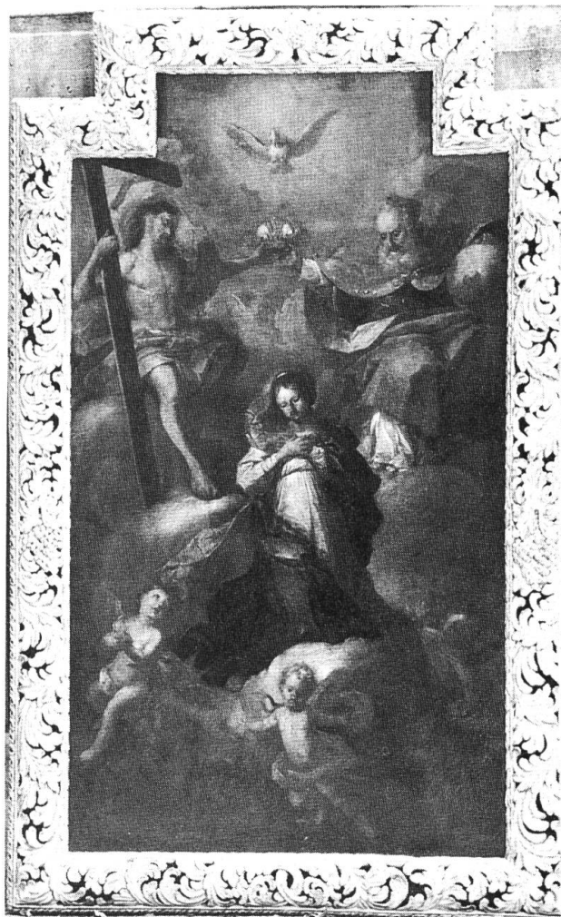
Marienkronung, Gemälde von Franz Carel Stauder 1708, in der katholischen Kirche Zuchwil.

So ist die Erinnerung an die verschwundene Emmenholz-Kapelle mit Kunstwerken verbunden, die heute noch das Interesse von Kunstfreunden finden.