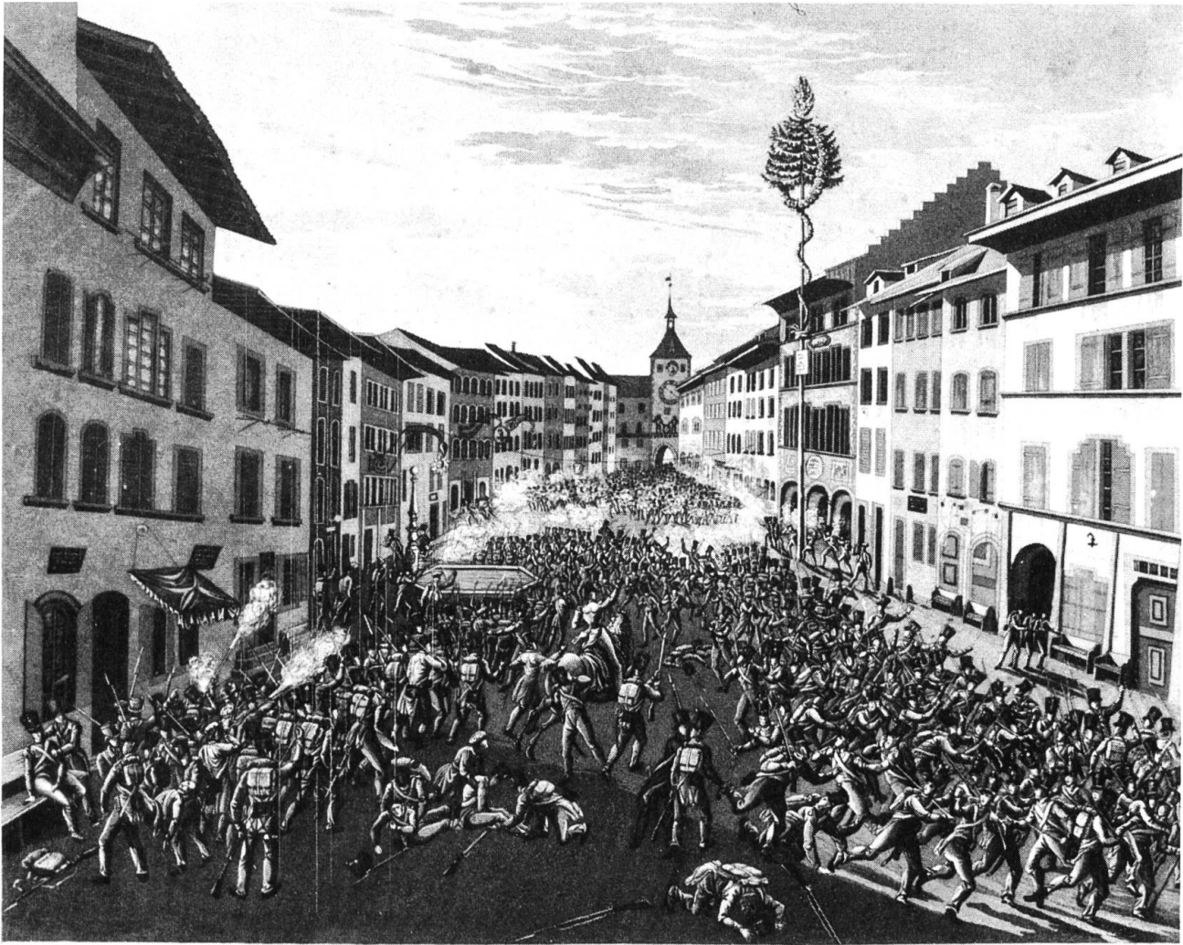
Das Liere in Liestal gegen dem obern Thor, am 21 ten August 1831.

Gefecht im Städtchen Liestal am 21. August 1831.