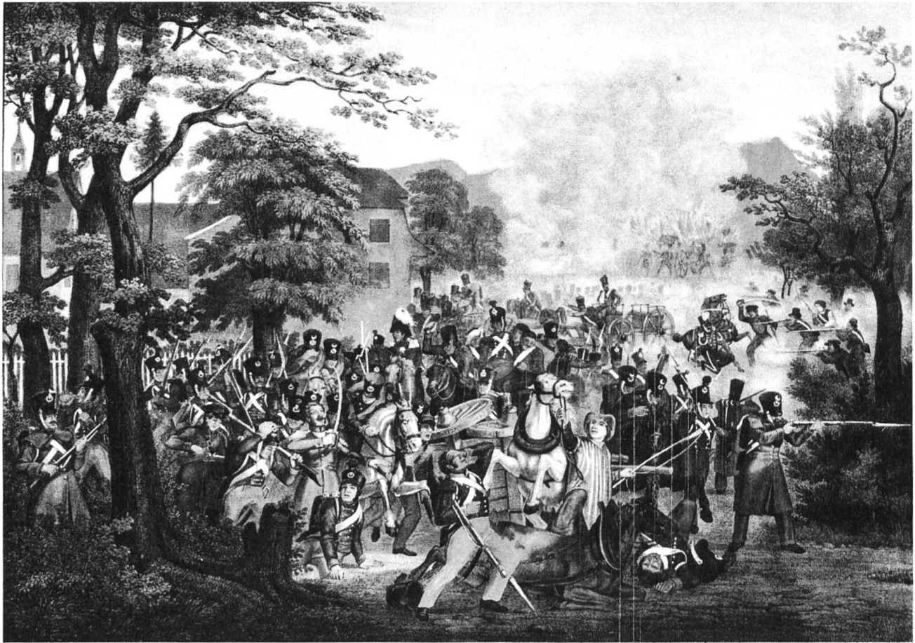
Die (entscheidende) Schlacht an der Hülfenschanze vom 3. August 1833: die Katastrophe für Basel.

selbst einen sehr wesentlichen Teil zu dem gewichtigen Unternehmen beigetragen hat, hat — mit Recht — mehr verlangt.