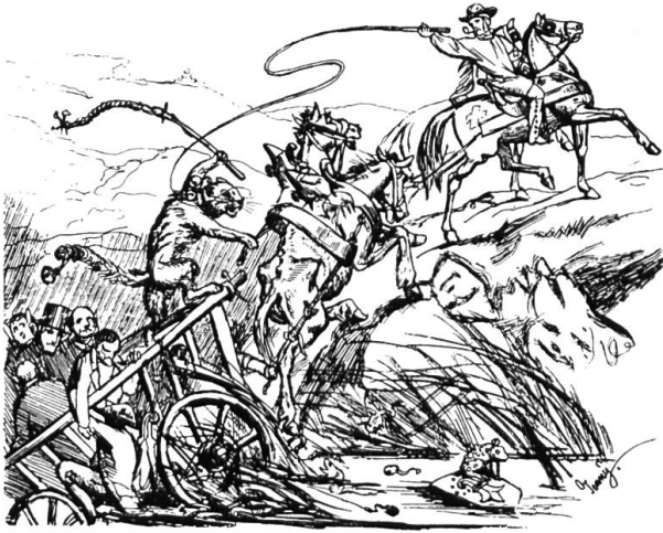
Wie der von Führmann Rolle in den Zumpf gefahrte landschaftliche Staatswagen mittelst eidgenössischen Vorspanns wieder herausgezogen werden muß.

Karikatur gegen die Revisionsbestrebungen von Christoph Rolle 1862.