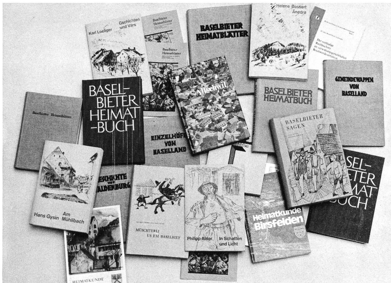
Ein bunter Strauss historisch-kultureller Publikationsreihen des Kantons Baselland.

Baselland. Dieses Unternehmen wäre wohl nur realisierbar, wenn die Kantonsgeschichte in einzelne Abschnitte unterteilt, mehrere Bände geplant und verschiedene Bearbeiter eingesetzt würden. Die Publikation sorgfältig ausgewählter Quellen würde sich als Ergänzung zur (vergriffenen) Kantonsgeschichte von 1932 und als Vorstufe zu einer neuen Darstellung lohnen, laden doch die lebhaften Debatten in Landrat und Verfassungsräten, die hitzigen Pressefehden, die eindrucksvollen Volksversammlungen, die Pamphlete, Gutachten, Gerichtsurteile, Statistiken usw. geradezu dazu ein, die Quellen selber sprechen zu lassen.