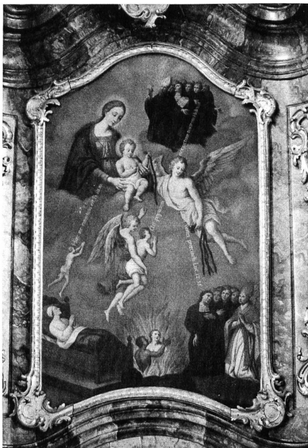
Maria als Trösterin der Sterbenden und der armen Seelen im Fegfeuer. Bruderschaftsbild auf dem linken Seitenaltar der Pfarrkirche Egerkingen.