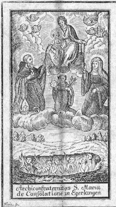
Archiconfraternitas S. Mariae de Consolatione in Egerkingen

Im Namen der allerheiligsten Dreifaltigkeit. Amen.