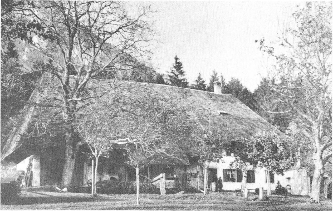
Galmis. Das Haus von Josef Reinhart vor dem Umbau. Ansicht von Südwesten.