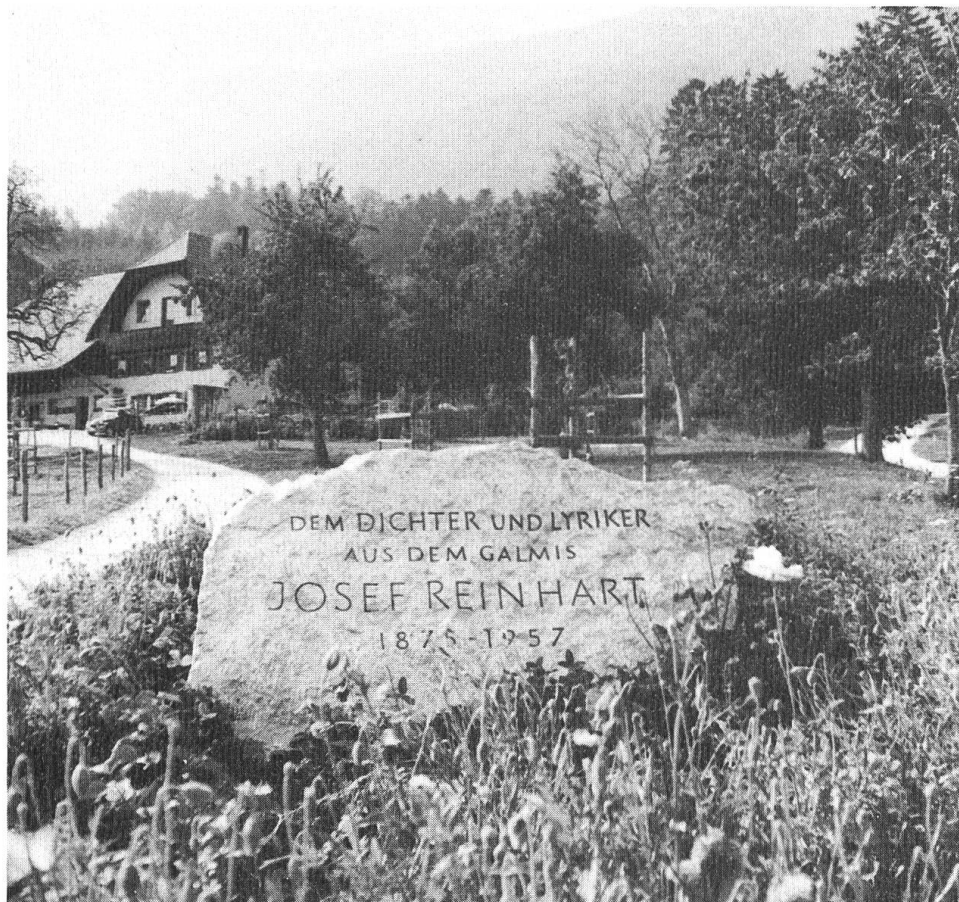
Der Josef Reinhart-Gedenkstein im Galmis (Übergabe am 2. Juni 1984).

und blüht im ganzen deutschen Sprachraum kräftiger als je. Aber zwischen dieser neuen Poesie und der Reinhartschen besteht keine Verbindung und die jüngere setzt nicht die ältere fort.